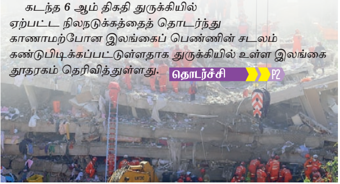
கடந்த 6 ஆம் திகதி துருக்கியில் ஏற்பட்ட நிலநடுக்கத்தைத் தொடர்ந்து காணாமற்போன இலங்கைப் பெண்ணின் சடலம் கண்டுபிடிக்கப்பட்டுள்ளதாக துருக்கியில் உள்ள இலங்கை தூதரகம் தெரிவித்துள்ளது. தொடர்ச்சி P2