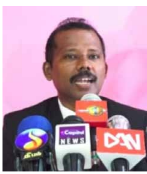
(தலைமன்னார் நிருபர் வாஸ் கூக்கு)

மன்னார் திருக்கேதீஸ்வரம் மனித புதை புதைகுழியில் கண்டுபிடிக்கப்பட்ட 81 பெட்டிகளில் உள்ளடக்கப்பட்டுள்ள மனித எச்சங்கள்; பரிசோதனைக்கு உட்படுத்த எட்டு மாதங்கள் நடைபெற வேண்டும் என வைத்திய குழாம் மன்றில் முன்வைக்கப்பட்டதை மன்று கட்டளையாக்கியுள்ளது. மன்னார் திருக்கேதீஸ்வரப் பகுதியில் 2013 ஆம் ஆண்டு கண்டுபிடிக்கப்பட்ட மனித புதைகுழி வழக்கானது அனுராதபுர நீதவான் நீதிமன்றில் அழைக்கப்பட்டு கண்டுபிடிக்கப்பட்ட மனித எச்சங்களை அமெரிக்கா புலோரிடா நிறுவனத்துக்கு காபன் பரிசோதனைக்காக கொண்டு செல்வதற்கு மாதிரிகள் தெரிவு செய்யப்பட்டுள்ள நிலையில் இவ் வழக்கு வியாழக்கிழமை (09) மன்னார் மாவட்ட நீதவான் நீதிமன்ற நீதிபதி கே. எல். எம். சாஜித் முன்னலையில் விசாரணைக்கு எடுக்கப்பட்டது. ஏற்கனவே ஜனவரி மாதம் 09ந் திகதி (09.01.2023) அநுராதபுரம் வைத்தியசாலையில் பாசாப்பு நோக்கி வைக்கப்பட்டிருந்த மன்னார் திருக்கேதீஸ்வரம் மனித புதைகுழியில் கண்டுபிடிக்கப்பட்ட மனித எச்சங்கள் கொண்ட 81 பெட்டிகளிலிருந்து இதில் 5 பெட்டிகளில் மாதிரிகள் தெரிவு செய்யப்பட்டிருந்தன. இவைகளை அநுராதபுரம் நீதவான் நீதிமன்ற காப்பகத்தில் வைக்கப்பட்டிருந்தன. இந்த சான்று பொருட்களை உரிய நடைமுறைகளை பின்பற்றி மன்னார் நீதவான் நீதிமன்ற காப்பகத்துக்கு சேர்ப்பிக்கும்படி குற்ற புலனாய்வு பிரிவினருக்கு