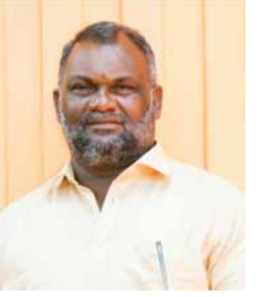
செய்த அரசாங்கங்கள் நிறைவேற்றாமல் இருப்பதென்பது அரசாங்கமே அரசியலமைப்பை மீறுவதாகவே அமையும்.