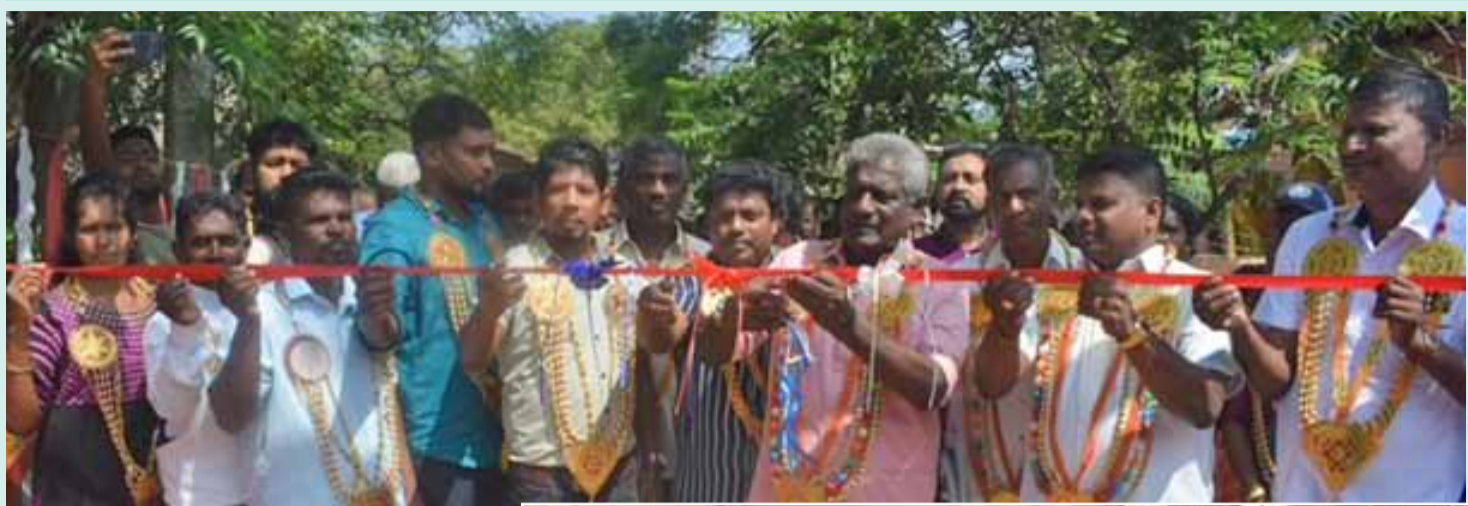
தலை போன்ற கோட்பாடுகளுடன் இருக்கும் எந்த கட்சியையும் நாம் விமர்சிப்பவர்களும் அல்ல.

தமிழர் கட்சிகள் பிரிந்து நின்று தமிழர் நலன் கருதாது தங்கள் கட்சிகள் வளர்ந்தால் தாங்கள் வளர்ந்தால் போதும் என்ற நிலைக்கு வந்த நிலையில் உள்ளூராட்சி மன்ற தேர்தலில் மன்னார் பிரதேச சபைக்குட்பட்ட சில கிராம மக்கள் ஒன்றுதிரண்டு சுயேட்சையாக களம் இறங்கியுள்ளது. இதன் வேட்பாளர் அறிமுக விழாவும் பேசாலையில் இதற்கான அலுவலகமும் திறந்து வைக்கப்பட்டபோது இது தொடர்பாக இங்கு ஒருசிலர் உரையாற்றும்போது கருத்துக்கள் தெரிவிக்கக்கூடியன. நாம் கடந்த காலத்தில் பாரம்பரிய கட்சி என அவர்களுக்கு எமது ஆதரவுகளை வழங்கி ஈற்றில் ஏமாற்றப்பட்டவர்களாக ஆகிவிட்டோம். எம்மில் பலர் இன உணர்வோடும் பணத்துக்காகவும் மதுவுக்காகவும் ஏமாற்றப்பட்ட ஒரு இனமாக நாம் இருக்கின்றோம். இந்த உள்ளூராட்சி மன்ற தேர்தல் மூலம் நாம் ஒரு அரசியலை மாற்றுபவர்கள் அல்ல. மாகாணசபையை மாற்றி அமைப்பவர்களும் அல்ல. ஆனால் மக்களால் தெரிவு செய்யப்பட்டவர்கள் மக்கள் நலன் நோக்காது தங்கள் சுயநல போக்கில் செயல்பட்டுள்ளனர். இவற்றுக்கெல்லாம் சங்கு ஊதும் ஒரு தேர்தலை சந்திக்கப் போகின்றோம். இதற்காக இங்கு பாரம்பரியமாக இருந்த தமிழ் உணர்வாளர்கள், தமிழ் தேசியம், தமிழர் உரிமை, தமிழர் விடு