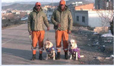
மேற்கொள்வதற்காக இந்திய மீட்டிக்குழுவினர் அண்மையில் துருக்கி சென்றிருந்தனர். இதன்போது மீட்டிக்குழுவினர் ஜூலி மற்றும் ரோமியோ என்ற இரு மோப்ப நாய்களும் அழைத்துச் செல்லப்பட்டிருந்தன.

துருக்கி- சிரியா எல்லையில் கடந்த 6 ஆம் திகதி சக்திவாய்ந்த நிலநடுக்கமொன்று ஏற்பட்டது. இதில் இருநாடுகளையும் சேர்ந்த சுமார் 33,000 க்கும் மேற்பட்டோர் உயிரிழந்தனர். இதனையடுத்து நிலநடுக்கத்தால் பாதிக்கப்பட்ட பகுதிகளில் மீட்டி நடவடிக்கைகளை