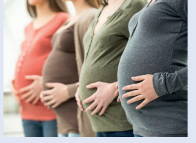
தங்கள் பிள்ளைகளுக்கு ஆர்ஜென்டினாவின்

ரஷ்யா - உக்ரேன் இடையே போர் இடம்பெற்று வரும் நிலையில், 5,000க்கும் மேற்பட்ட ரஷ்யக் கர்ப்பிணிகள் ஆர்ஜென்டினாவுக்குச் சென்றுள்ளதாகத் தகவல் வெளியாகியுள்ளது. மகப்பேறுக்கு ஒருவார காலமே எஞ்சியிருக்கும் நிலையில், பிறக்கும்