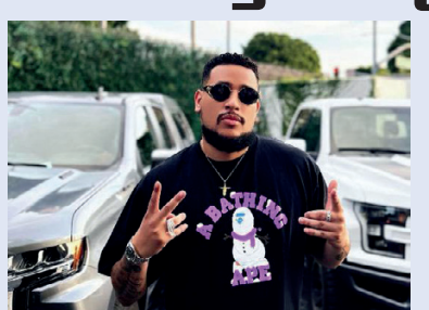
தினத்தன்று டர்பன் நகரில் உள்ள உணவகத்திற்கு வெளியே

ஏகேஏ (AKA) என அழைக்கப்படும் பிரபல தென்னாபிரிக்க ரப் பாடகரான கீரன் போர்ப்ஸ் கடந்த 10 ஆம் திகதி மர்ம நபர்களால் சுட்டுக் கொல்லப்பட்டார். தென் ஆபிரிக்காவைச் சேர்ந்த முன்னணி பாடகரான இவர் ஏராளமான ரப் பாடல்களைப் பாடியுள்ளார். இந்நிலையில், சம்பவ