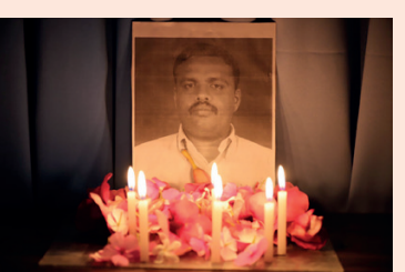
படத்துக்கு சுடர் ஏற்றி, மலரஞ்சலி செலுத்தப்பட்டது.