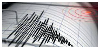
கடந்த 10, 11ஆம் திகதிகளில் மொனராகலை மாவட்டத்தின் புத்தல பிரதேச செயலாளர் பிரிவின் பல கிராமங்களில் சிறிய அளவிலான நிலநடுக்கம் உணரப்பட்டது. தொடர்ச்சி P2