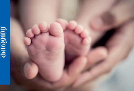
நாய்க்குரில், மனைவி மீதான ஆத்திரத்தில் தனது இரு மகன்களை தந்தையொருவர் கழுத்தை நெறித்துக் கொலை செய்த சம்பவம் அதிர்ச்சியை ஏற்படுத்தியுள்ளது.

இந்நிலையில் குறித்த இரு மோப்ப நாய்களும் நூர்தாகியில், இடிபாடுகளுக்கு அடியில் சிக்கியிருந்த 6 வயதான சிறுமியொருவரைக் காப்பாற்றியுள்ளதாகத் தகவல் வெளியாகியுள்ளது.