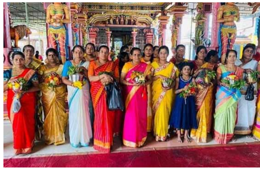
காரைதீவு விபலானந்த சதுக்கத்தில் அமைந்துள்ள அரஶ்டீ சீர்தி விநாயகர் ஆலய கும்பாபிஷேக தின அஷ்டோத்திர சத சங்காபிஷேக பூசை பாரத்குடபவனிபுடன் சங்காபிஷேககுரு சீவயூ சண்முக மகேஸ்வர குருக்கள் தலைமையில் நேற்று முன்தினம் நடைபெற்ற போது...