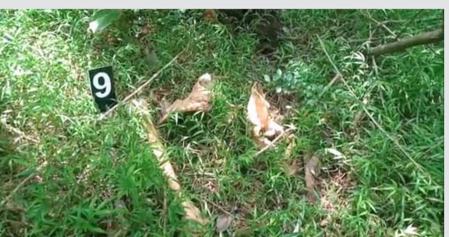
லாம் என பொலிஸார் சந்தேகிக்கின்றனர். இது தொடர்பான விசாரணைகளை வவுனியா ஈரப்பெரியகுளம் பொலிஸார் மேற்கொண்டு வருகின்றனர்.