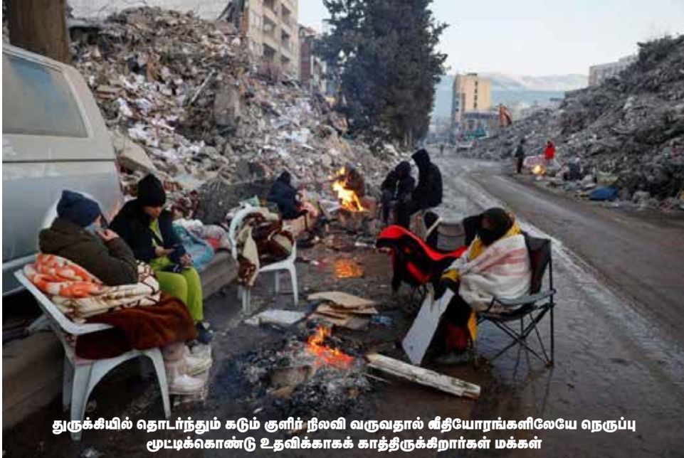
துருக்கியில் தொடர்ந்தும் கடும் குளிர் நிலவி வருவதால் வீதியோரங்களிலேயே நெருப்பு மூடிக்கொண்டு உதவிக்காகக் காத்திருக்கிறார்கள் மக்கள்

துருக்கியில் ஏற்பட்ட வரலாறு காணாத நிலநடுக்கத்தால் துருக்கி மற்றும் அதன் அண்டை நாடான சிரியாவில் உயிரிழந்தோர் எண்ணிக்கை 35 ஆயிரத்தை எட்டியுள்ளது. இந்நிலையில் மேற்குலகப் பொருளாதாரத் தடை, உள்நாட்டுப் போர், போதிய மருத்துவக்