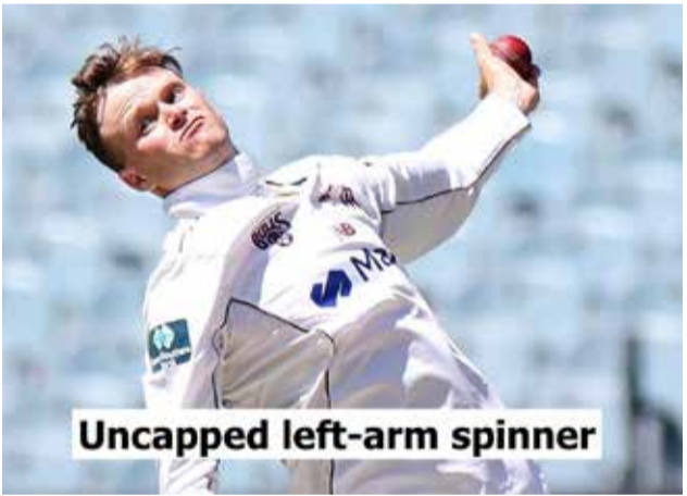
Uncapped left-arm spinner