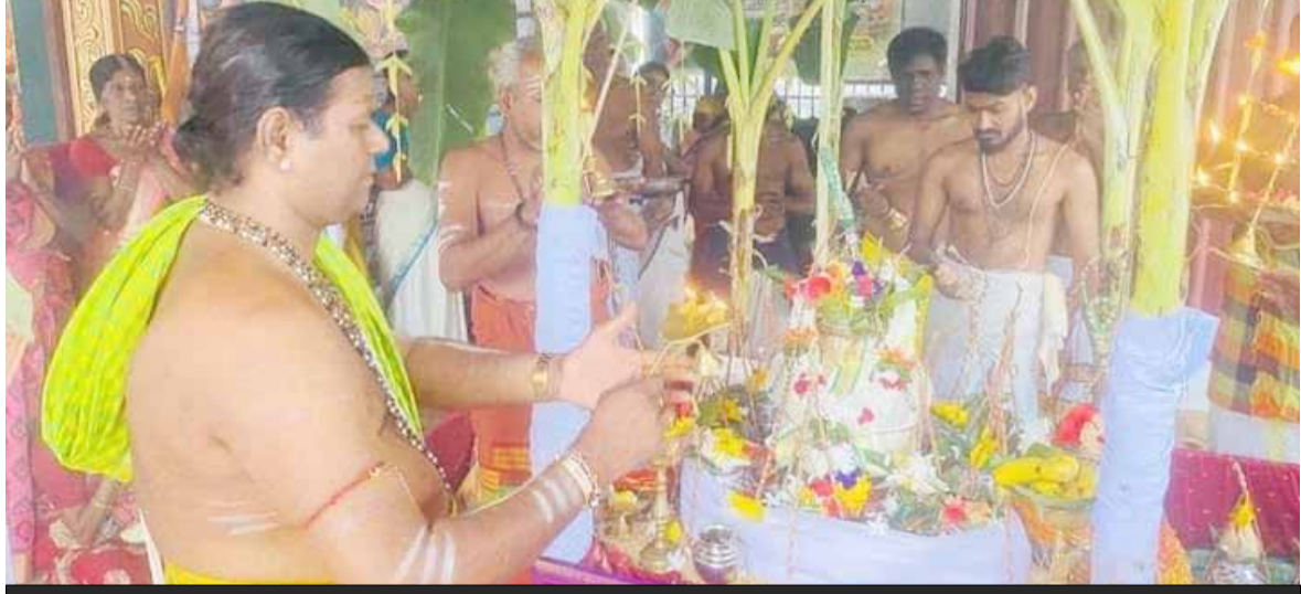
காரைதீவு விபுலானந்த சதுக்கத்தில் அமைந்துள்ள அரசு சிறி சித்தி விநாயகர் ஆலய கும்பாபிஷேக தின அஷ்டோத்திர சத சங்காபிஷேக பூசைபாற்குடபவனியுடன் சங்காபிஷேககுரு சிவசிறி சண்முக மகேஸ்வர குருக்கள் தலைமையில் நடைபெற்றது.

பெரிய நீலாவணை, மருதமுனை, சம்மாந்துறை பகுதிகளுக்கு போதைப்பொருட்களை விநியோகிக்கின்ற பிரதான வியாபாரி என பொலிஸார் குறிப்பிட்டனர். தொடர்ந்து கைதான சந்தேக நபரின் கல்முனை மற்றும் சாய்ந்தமருது பகுதியில் உள்ள வீடுகள் பொலிஸாரின் மோப்ப நாய்களின் உதவியுடன் சோதனைகள் பொலிஸாரினால் முன்னெடுக்கப்பட்டிருந்தன. குறித்த சோதனை நடவடிக்கையின்போது கல்முனை பகுதி செயலாளர் வீதியில் அமைந்துள்ள சந்தேக நபரின் சகோதரியின் வீடு மற்றும் சாய்ந்தமருது பகுதியில் உள்ள சந்தேக நபரின் வீடும் பொலிஸ் குழுக்களினால் சோதனைக்குள் ளாக்கப்பட்டது. இதன்போது ஒரு தொகுதி போதைப்பொருட்கள் 2 அதிநவீன ஸ்கானர்கள், சி.சி.வி, டிவீஆர் உபகரணம் பதிவு செய்யப்படாத ட்ரோன் பறக்கும் சாதனம் உள்ளிட்டவைகள் பொலிஸாரினால் மீட்கப்பட்டன. குறித்த வீட்டில் இருந்த சந்தேக நபரின் சகோதரியான 40 வயது மதிக்கத்தக்க பெண் ஒருவரும் கல்முனை தலைமையக பொலிஸாரினால் கைது செய்யப்பட்டு விசாரணைக்காக அழைத்துச் செல்லப்பட்டார். (அ)