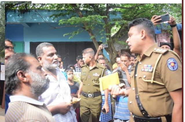
நிலைய பொறுப்பதிகாரி எஸ்.எம்.எல்.ஆர். பண்டார கட்டிட உரிமையாளருடன் கலந்துரையாடியதற்கு அமைய கோபுரம் அமைக்கும் வேலைகள் தற்காலிகமாக