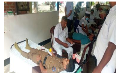
இரத்ததான நிகழ்வு சனிக்கிழமை (11) காத்தான்குடி பொலிஸ் நிலையத்தில் இடம்பெற்றது.