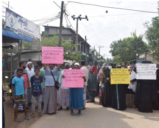
இது தொடர்பாக ஆராய்வதற்காக வேண்டி தொலைத்தொடர்பு கோபுரத்தை பொருத்தும் பணிகளை ஒரு வாரத்துக்கு இடைநிறுத்தி வைக்குமாறு பொலிஸ்

தொலைத்தொடர்பு கோபுரத்தை நிறுத்துமாறு கோரிக்கை விடுத்து அதிகாரிகளிடம் மகஜர் கையளிக்கப்பட்டதுடன்,