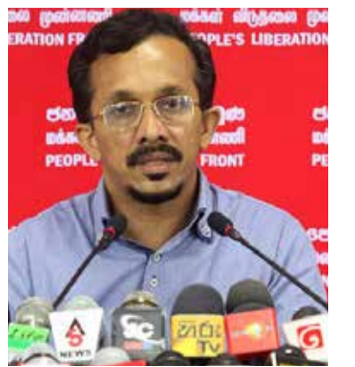
மாதாந்த கொடுப்பனவு, போக்குவரத்து வசதிகள் மற்றும் ஓய்வூதியம் போன்றவை வழங்கப்படுகின்றன - என்றார்.

குறித்த சட்டத்தின் மூலம் முன்னாள் ஜனாதிபதிகளுக்கு வாடகை இல்லா வசிப்பிடம்,