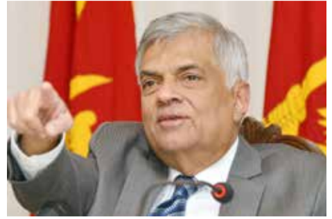
ஸ்திரத்தன்மையின் கட்டத்தில் இருப்பதாகவும் சர்வதேச நாணய நிதியத்தின் அங்கீகாரத்தைப் பெறுவதற்கு, நாட்டில் அரசியல் ஸ்திரத்தன்மை மற்றும் சமூகத்தில் புதிய அணுகு முறைகள் அவசியம் என்றும் குறிப்பிட்டுள்ளார். (ஐ)

கொழும்பு, பெப். 16 மார்க் மாதத்துக்குள் சர்வதேச நாணய நிதியத்தின் அனுமதி கிடைக்கும் என ஜனாதிபதி ரணில் விக்கிரமசிங்க நம்பிக்கை வெளியிட்டுள்ளார். இதன்படி இலங்கையின் கடன் மறுசீரமைப்பு நடவடிக்கை மார்க் மாதத்துக்குள் ஆரம்பிக்கப்படும் என்ற அறிவிப்பை சர்வதேச நாணய நிதியம் வெளியிடும் என்றும் குறிப்பிட்டுள்ளார். கொழும்பில் நேற்று புதன்கிழமை காலை நடைபெற்ற நிகழ்வொன்றில் உரையாற்றும் போதே ஜனாதிபதி ரணில் விக்கிரமசிங்க இதனை தெரிவித்துள்ளார். இலங்கை தற்போது பொருளாதார