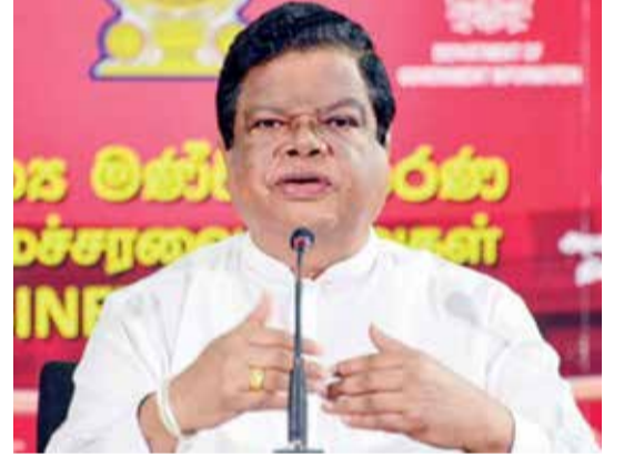
பெரும்பாடுபட்டு வருகின்றனர். இந்த முயற்சி வெற்றியடையாமலிருக்க முடியாது.

எவ்வாறிருப்பினும் இந்த கால அவகாசம் போதாது என்று சர்வதேச நாணய நிதியம் குறிப்பிட்டுள்ளது. ஜனாதிபதி, திறைசேரி மற்றும் மத்திய வங்கி அதிகாரிகள் எவ்வாறேனும் மார்ச் இறுதிக்குள் இதனை நிறைவடையச் செய்வதற்கு