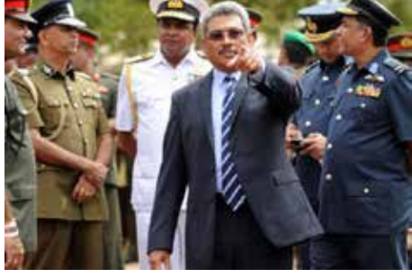
தமிழீழ விடுதலைப் புலிப் பயங்கரவாத அமைப்பின் தலைவர் பிரபாகரனுக்கு 2009 இல் எமது படையினர் முடிவுகட்டி விட்டார்கள்

என போரின் போது பாதுகாப்பு அமைச்சின் செயலாளராகப் பணியாற்றிய வரும், முன்னாள் ஜனாதிபதியுமான கோட்டாபய ராஜபக்ஷ தெரிவித்தார் எனத் தெரிவிக்கப்படுகின்றது.