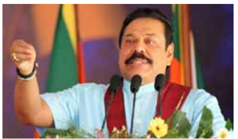
27 பிரதானக் கூட்டங்கள் மொட்டுக் கட்சியால் ஏற்பாடு செய்யப்பட்டுள்ளன.

உள்ளூராட்சி சபைத் தேர்தலை முன்னிட்டு ரீலங்கா பொதுஜன பெரமுன கட்சியின் முதலாவது பிரதான தேர்தல் பிரசாரக் கூட்டம் அநுராதபுரத்தில் நடைபெறவுள்ளது. நாடாளுமன்ற உறுப்பினர் மஹிந்த தானந்த அளுத்தமகே இந்தத் தகவலை உட்கவியலாளர் வெளியிட்டுள்ளார். கட்சித் தலைவர் மஹிந்த ராஜபக்ஷ, தேசிய அமைப்பாளர் பனில் ராஜபக்ஷஷ உட்பட கட்சி முக்கியஸ்தர்கள் பங்கேற்கும்