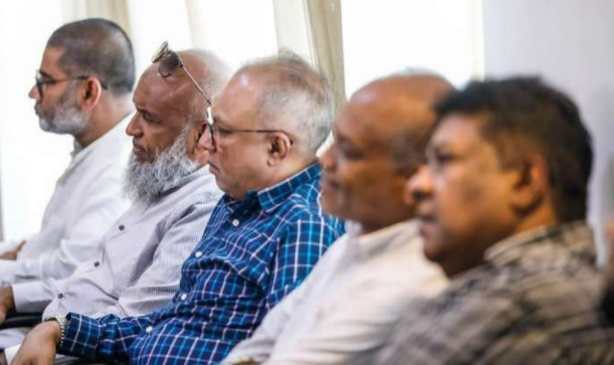
கொழும்பு நகர முஸ்லிம் வர்த்தக பிரதிநிதிகள் மற்றும் புத்திஜீவிகள் நேற்று எதிர்க்கட்சித் தலைவர் அலுவலகத்தில் எதிர்க்கட்சித் தலைவர் சஜித் பிரேமதாஸவைச் சந்தித்தனர். தற்போது அவர்கள் எதிர்நோக்கும் பிரச்சினைகள் குறித்து விரிவாக கலந்துரையாடப்பட்டதுடன், வர்த்தக சமூகம் தொடர்பான கொள்கை மற்றும் பணி ஒழுங்கு குறித்தும் இங்கு விளக்கப்பட்டது.