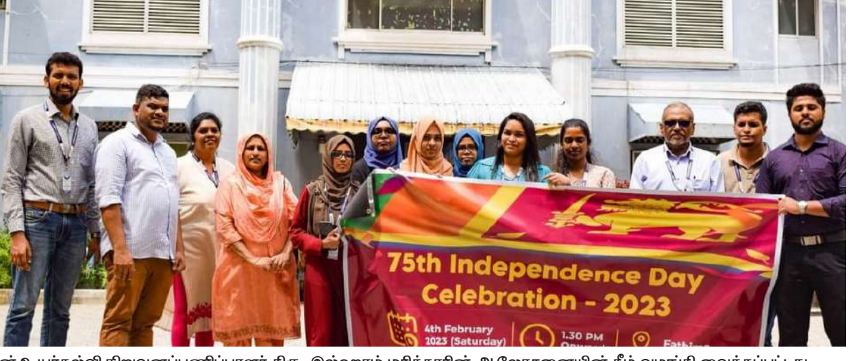
4th February 2023 (Saturday) 1:30 PM