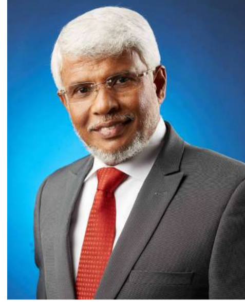
அமுல்படுத்தக்கூடாது. முஸ்லிம்களும் இதில் திருப்தியடைய வேண்டும்.

முன்வந்துள்ளன. பரிஸ் கிளபிலுள்ள நாடுகள் கூட எமது நாட்டுக்கு உதவத் தயாராகின்றன. சர்வதேச நாணய நிதியம் கடன் அடிப்படையில் உதவுவதற்கான சகல ஏற்பாடுகளையும் நிறைவு செய்திருக்கிறது. நாட்டுக்கு விஜயம் செய்த பான்சீமூன் மற்றும் பெற்றீசியாஸ்கொட்லண்ட் ஆகியோரும் எமது பொருளாதாரத்தை கட்டியெழுப்ப உதவ உள்ளனர். இந்த முன்னேற்றங்களின் யதார்த்தத்தை எவரும் மறந்து பேச முடியாது. இன்றைய நிலையில் அரசியலமைப்பின் 13 ஆவது திருத்தம் மற்றும் உள்ளூராட்சித் தேர்தல்கள் பற்றிப் பேசப்படுகிறது. 13 ஆவது திருத்தம் தமிழர்களை மட்டும் திருத்திப்படுத்துவதற்கு