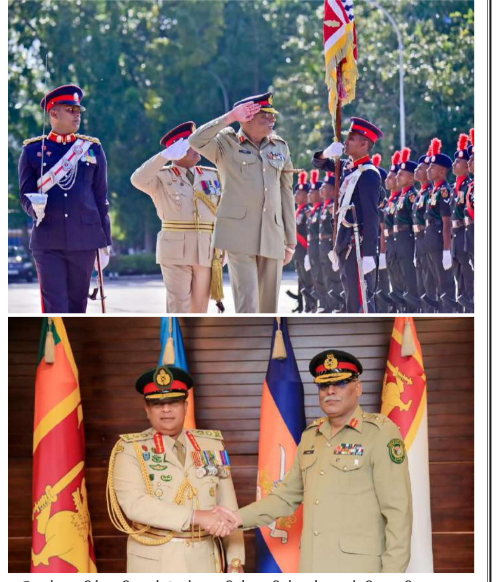
இலங்கையிற்கு விஜயம் செய்த பாகிஸ்தானின் முப்படைப் பிரதானி சஹீர் சம்சாத் மிர்சாவுக்கு விமான நிலையத்தில் செங்கம்பள வரவேற்பு அளிக்கப்பட்டது. படப்பட பிரதானி சவேந்திர சில்வா அவரை வரவேற்பதையும் படத்தில் காணலாம்.