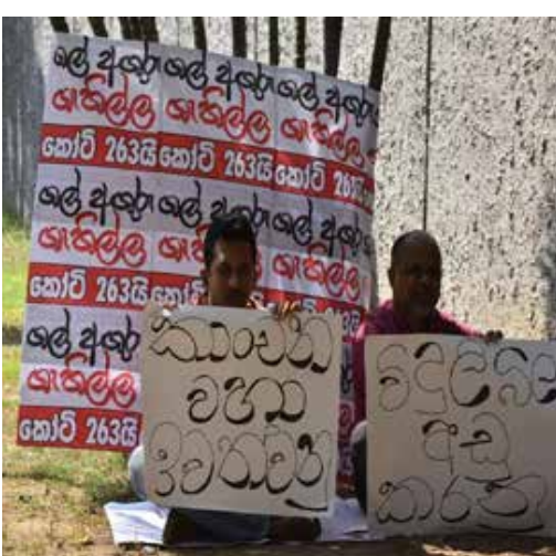
மின்சாரக் கட்டணம் திடீரென பெருமளவில் அதிகரிக்கப்பட்டதைக் கண்டித்து பாவனையாளர்கள் இருவர் இன்று மின்சக்தி மற்றும் வலுச் சக்தி அமைச்சின் முன்பாக அமைதிப் போராட்டத்தில் ஈடுபட்டனர். எதிர்ப்பு கோசங்கள் அடங்கிய பதாகைகளுடன் அவர்கள் தமது எதிர்ப்பை வெளிப்படுத்தினர்.

முன்னாள் ஜனாதி பதி கோட்டாபய ராஜபக் வும் அவரது மனைவி அயோமா ராஜபக்ஷவும் இன்று காலை கட்டுநாயக்க விமான நிலையம் ஊடாக சீனாவுக்குப் புறப்பட்டுச் சென்றனர். மலேஷியாவின் கோலாலம்பூர் விமான நிலையத்திற்குச் செல்லும் அவர்கள் அங்கிருந்து சீனாவுக்குப் புறப்படுவார் கள் என எதிர்பார்க்கப்படு வதாக விமான நிலையத் தகவல்கள் தெரிவிக்கின்றன. மலேஷியன் ஏர் லைன்ஸ் விமானத்தில் இருவரும் இன்று அதி காலை 12.25 மணிக்கு புறப்பட்டனர்.