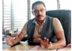
அதிகரிப்பது தொடர்பான அமைச்சரவையின் முடிவை ஏற்க முடியாது என்று ஆணைக்குழுவின் தலைவர்

சென்று அலுவலகத்தை மூடி முத்திரையிடும் உத்தரவைப் பெற்றனர். ஆணைக்குழுவின் தலைவர் தற்போது நாட்டில் இல்லை என்று கூறப்படுகின்றது. அவர் இல்லாத நிலையிலேயே அலுவலகத்தை மூடி முத்திரையிட்டுள்ளனர் பொலிஸார். மின்சாரக்கட்டணத்தை