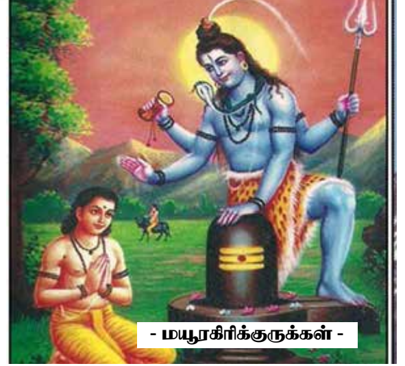
- மயூரகிரீக்குருக்கள் -

உருவத்தோடுகண்டால்தான் ஆனந்தம் உண்டாகும். அதற்காகத்தான் உருவமற்ற பரமேசுவரனான சிவபெருமான் அருவருவான லிங்கமானதோடு நில்லாமல், அந்த லிங்கத்துக்குளேயே திவ்யரூபம் காட்டும் லிங்கோத்பவ மூர்த்தியாக இருக்கிறார். இப்படி ரூபத்தைக் காட்டினாலும், உண்மையில் தமக்கு அடியும் இல்லை, முடியும் இல்லை, அதாவது ஆதியும் அந்தமும் அற்ற ஆனந்தப்பா பொருளே தாம் என்று உணர்த்துவதற்காக, மேலே லிங்க வட்டத்துக்குள் ஜடாமுடி முடியாமலும், கீழே அந்த மாதிரியே தம் பாதம் அதற்குள் அடங்காமலும் இருப்பதாகக் காட்டுகிறார். அடிமுடி எல்லை இல்லாமல், அவர் ஜ்யோதி ஸ்வரூபமாக நின்றார். ஜ்யோதிர்லிங்கமாக, ஆகாயத்துக்கும் பூமிக்குமாக பரமசிவன் காட்சி தந்த இரவே சிவராத்திரியாகும். இந்த மகோன்னதமான இரவு குறித்து எத்தனை எத்தனையோ கதைகள், புராணச் செய்திகள்