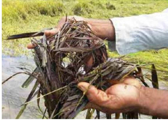
வில்லை. இதனால் பெரும் நஷ்டத்தை எதிர்நோக்கியுள்ளதாக விவசாயிகள் தெரிவித்தனர்.

அரசாங்கம் உத்தரவாத விலைக்கு நெல்லை கொள்வனவு செய்வதாக அறிவித்தும் ஆக்கபூர்வமான எந்த விதமான நடவடிக்கையும் எடுக்க