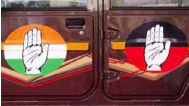
ஈரோடு கிழக்குத் தொகுதி - சில அடிப்படத் தகவல்கள்

'அயலி' கதை உருவானது எப்படி? 'கொரோனா பெரிடர் காலத்தின் போது, சென்னை அசோக் நகரில் நண்பர் ஒருவருடன் இருந்த போது, அங்கிருந்த பிள்ளையார் கோயிலில் நவ நாகரிக ஆடை அணிந்த வட இந்திய பெண், தனது தாயாருடன் வணங்கியதைப் பார்த்தேன். அப்போது, தமிழ்நாட்டில் பெண்கள் உயர்ந்த நிலையை எட்டியிருப்பதாகக் கூறி நண்பரிடம் சிலாகித்தேன். அதற்கு அவர், சில நாட்களுக்கு முன்புதான் புதுக்கோட்டையில் பூப்பெய்த சில மாதங்களிலேயே சிறுமி ஒருவருக்கு திருமணம் நடந்ததாக தெரிவித்தார். குழந்தை திருமணம் வழக்கொழிந்து விட்டதாக நான் கருதியிருந்த நேரத்தில், நண்பரின் பதில் அதிர்ச்சியளித்தது. அந்த நிகழ்வு தந்த வேதனையில்தான், குழந்தை திருமணத்திற்கு எதிரான படத்தை உருவாக்க திட்டமிட்டேன். ஒரு கிராமமே அந்த நிலையில்