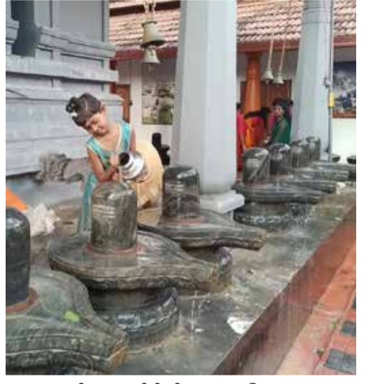
மகா சிவராத்திரி தினமான நேற்று நாவற் குழி திருவாசக அரண்மனையில் சிறுமி ஒருவர் சிவலிங்கத்துக்கு தண்ணீரால் அபிஷேகம் செய்கிறார்...

கொழும்பு, பெப். 19 அமெரிக்க விமானப்படையின் இரண்டு விமானங்களில் அண்மையில் கொழும்புக்கு விஜயம் மேற்கொண்ட அமெரிக்க உயர்மட்டக் பாதுகாப்புக் குழு தொடர்பில் கொழும்பு அரசியல் வட்டாரங்கள் பலத்த சந்தேகத்தைக் கிளப்பியிருக்கின்றன.