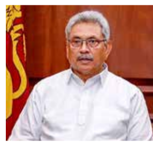
எனாள் ஜனாதிபதி மியன்மார் சென்றுள்ளதாகவும், அங்கு அவர் மத ஸ்தலங்களில் வழிபாடுகளில் ஈடுபடவுள்ளதாகவும் அவருக்கு நெருக்கமான வட்டா

ரங்கள் தெரிவித்துள்ளன. அண்மையில், கோட்டாபய ராஜபக்ஷவும் அவரது மனைவி அயோமா ராஜபக்ஷவும் கட்டுநாயக்க விமான நிலையத்தின் விசேட விருந்தினர் முனையத்தின் ஊடாகவோ, சாதாரண பயணிகள் முனையத்தின் ஊடாகவோ செல்வதற்கான வாய்ப்பு இருந்தபோதும், அவர்கள் சரக்கு முனையத்தினூடாக மலேசியாவிற்கு புறப்பட்டுச் சென்றனர். (அ)