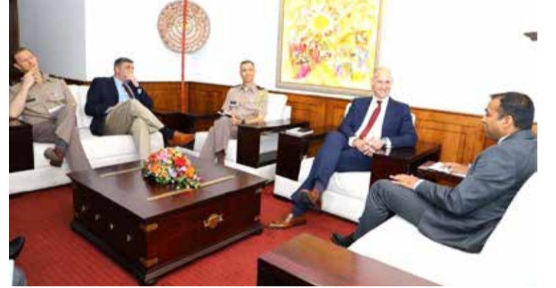
அமெரிக்காவுடனான பாதுகாப்பு உறவு, இந்தோ-பசுபிக் பாதுகாப்பு உறவு, பிராந்திய ஸ்திரதன்மை, ரஷ்ய-உக்ரைன்

திருகோணமலையில் தளமொன்றை அமைப்பதற்கு அமெரிக்காவும் இந்தியாவும் திட்டமிடுகின்றன என ஊகங்கள் வெளியாகியுள்ளன. இந்த சந்திப்பின்போது