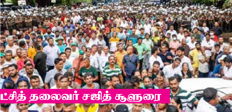
எதிர்க்கட்சித் தலைவர் சஜித் சூளுரை

முன்வைத்த காலை ஒரு போதும் பின்வைக்க நாம்தயாரில்லை. தேர்தலைப் பெறும் வரை எமது போராட்டம் தொடரும். இவ்வாறு எதிர்க்கட்சித் தலைவரும் ஐக்கிய மக்கள் சக்தியின் தலைவருமான சஜித் பிரேமதாஸு தெரிவித்தார். கொழும்பில் நேற்று ஐக்கிய மக்கள் சக்தியால் ஏற்பாடு செய்யப்பட்ட