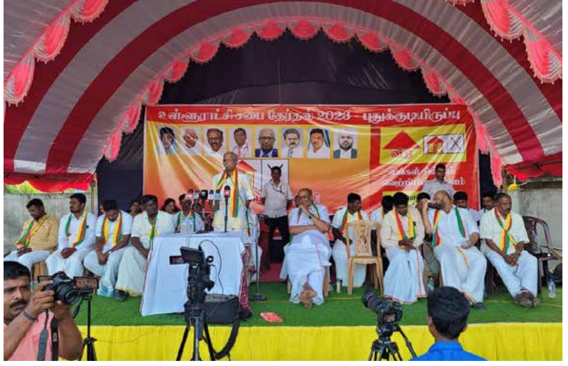
இந்தத் தேர்தலின் முக்கியத்துவத்தை உணர்ந்த காரணத்தால்தான் தேர்தலைப் பிற்போட முனைகின்றார்கள். தேர்தல் வந்தால் ஆட்சியில் இருப்பவர்களை மக்கள் தூக்கி கடாசி விட்டார்கள் என்பது தெட்டத்தெளிவாகத் தெரியவரும் - என்றார்.

மக்கள் தேர்தல் நடக்குமா என்று கேட்கின்றார்கள். ஜனாதிபதிக்கு தேர்தலைச் சந்திக்கப் பயம். இதன் காரணத்தால் தேர்தலை பிற்போடப் பார்க்கின்றார்கள். மாகாண சபைத் தேர்தலையும் பெரும் சூழ்சியால் காலவரையறையின்றிப் பிற்போட்டுவிட்டார்கள். 2019 ஆம் ஆண்டு மாகாண சபைத் தேர்தலை நடத்துவதற்காக தனிநபர் சட்டவரைவை நாடாளுமன்றத்தில் நான் சமர்ப்பித்தேன். இப்போது அவர்கள் என்ன செய்கின்றார்கள்? மாகாண அதிகாரமும் கிடையாது. உள்ளூராட்சி அதிகாரங்களையும் பாவிக்கவிடாமல் பறித்து எடுத்துவிட்டார்கள். மக்கள் ஆணை இல்லாமல் குறுக்கு வழியில் ஜனாதிபதியாக வந்த ஒருவர் முழு அதிகாரத்தையும் தன் கைக்குள் கொண்டு வரும் சூழ்ச்சிதான் தேர்தலைப் பிற்போட எடுக்கப்படும் நடவடிக்கை. இதற்கு எதிராக நாங்கள் திரண்ட டெழுவேண்டும்.