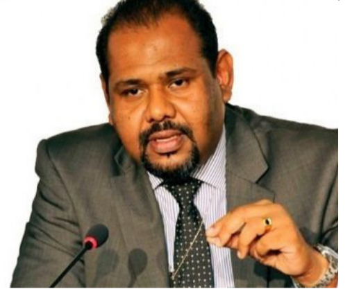
விடுதலைப் புலிகள் இயக்கத்துக்கு எதிராக ஒரு வலைப்பின்னலை ஏற்படுத்தி, இராணுவ ரீதியாக விடுதலைப் போராட்டத்தை அழிப்பதற்குரிய (08ம் பக்கம் பார்க்க)

தீர்வுக்குரிய ஆரம்பப்பள்ளியாக இருக்க முடியாது என்பது தமிழ்த் தேசிய அரசியலைப் புரிந்துகொண்ட அனைவருக்கும் தெரிந்த விடயம். ரணில் விக்கிரமசிங்க, முன்னைய ஆட்சிக் காலங்களில் தமிழ் மக்களுடன் பேசும் சந்தர்ப்பங்களில் எப்படி நடந்து கொண்டிருந்தார் என்பதையும் நாம் பார்க்க வேண்டும். 2001, 2002 ஆம் ஆண்டு தமிழீழ விடுதலைப் புலிகளோடு பேச்சுவார்த்தைக்கு இணங்கிய போது, சிறிலங்கா அரசின் பொருளாதாரம் இன்றைய நிலையை ஒப்பிடக்கூடிய அளவுக்கு பாரிய வீழ்ச்சியடைந்திருந்தது. போரிலும் கூட சிறிலங்கா அரசு பின்னடைவை சந்தித்திருந்த சூழலில் தான், தமிழீழ விடுதலைப்புலிகள் இயக்கத்துடன் ரணில் விக்கிரமசிங்க போர் நிறுத்த உடன்படிக்கைக்கு சென்று, தான் சமஸ்திரை தீர்வை கொடுப்பதாக கருத்தைத் தெரிவித்திருந்தார். இறுதியில் பேச்சுவார்த்தைகளின் போது, தமிழீழ