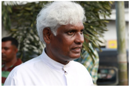
தமிழக அரசை போன்று தமிழ் மக்களின் நீண்ட கால கோரிக்கையான அரசியல்