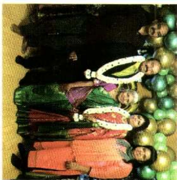
ரவிலாளர்களின் வெறுப்பு நிதியை