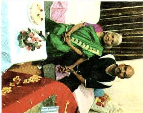
இருவரும் கொண்டு வந்த சிறிய நிதியை