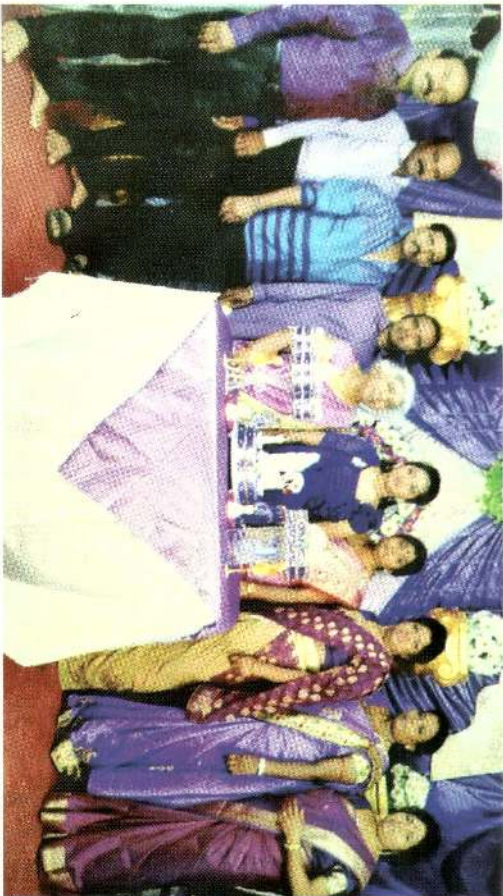
அரசாங்க மருத்துவமனை சிகிச்சைக்கு வந்தவர்கள்