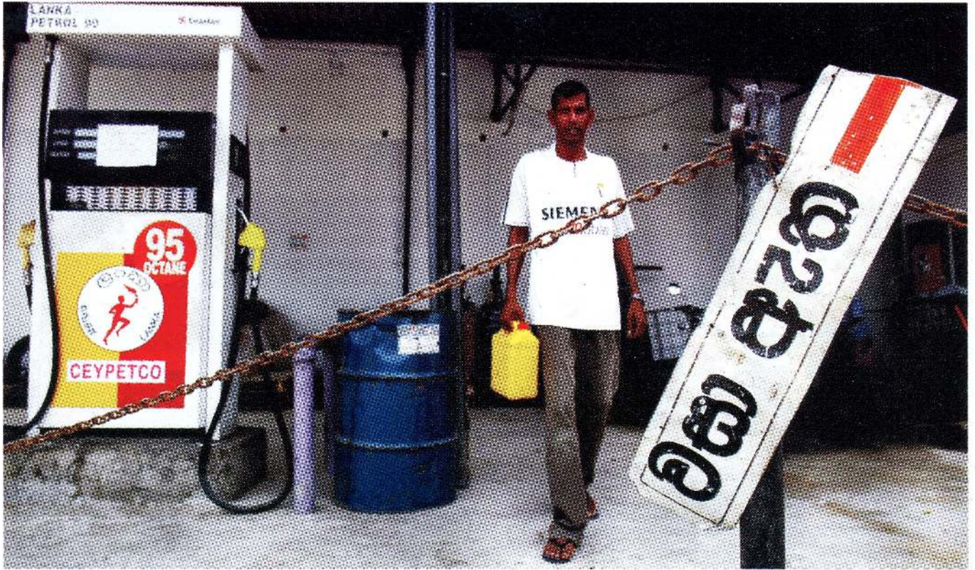
பன்மைத்துவம் : எழுது செய்தியறையில் நாம் கூறும் கேட்கும் செய்திகளைப் போல் பன்மைத்துவம் நிலவுதல் பொதுமக்கள் சேவை ஊடகவியலின் முக்கிய அம்சமாகும்.