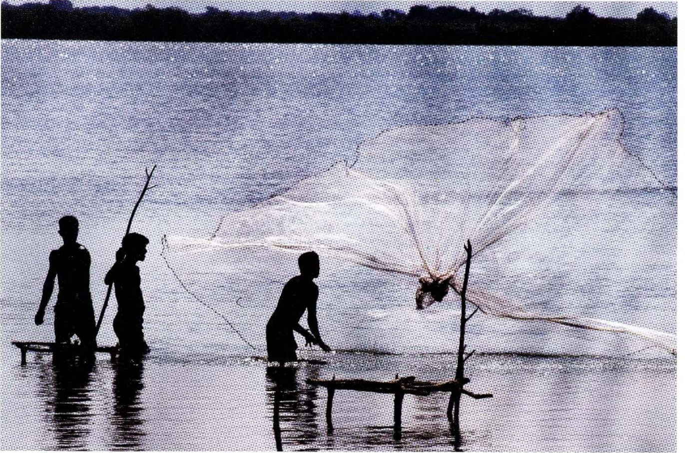
வலை வீசுதல் : பதிப்பாசிரியர் சுதந்திரம் தொடர்பாக தம்மால் கேட்கப்படும், வாசிக்கப்படும் செய்திகள் தொடர்பாக நம்பகத்தன்மையை ஏற்படுத்தும் உரிமையாளரின் கண்ணாடியினூடாக செய்திகளை தேர்ந்தெடுத்துக் கொள்ளாதிருப்பதற்கான நெறிமுறை செய்தி ஊடகத்திற்குள்ளது.

தமது பணியில் தலையீடுகள் ஏற்பட்டமை குறித்துப் பெரும்பாலான இலங்கை ஊடகவியலாளர்கள் பல சந்தர்ப்பங்களைக் காட்டி இயலும். ஒன்றில் தாம் எழுதிய சம்பவம் வெளிவரவில்லை அல்லது அது மாற்றங்களோடு வந்தது. அல்லது குறித்த செய்தி வெளிவரும் பட்சத்தில் அவர்கள் அச்சுறுத்தலுக்குள்ளாகினர். பெரும்பாலும் இத் தலையீடுகள் நிகழ்வதற்குக் காரணம் (அரசியல்வாதிகள் மற்றும் ஆர்வமுள்ள குழுக்கள் போன்ற) வெளிநபர்கள் ஊடகவியலாளரை அல்லது பதிப்பாசிரியரை அணுகுவதால், அல்லது உரிமையாளர் / வெளியீட்டாளர் பதிப்பாசிரியர் பணியில் தலையீடுவதால் ஆகும்.