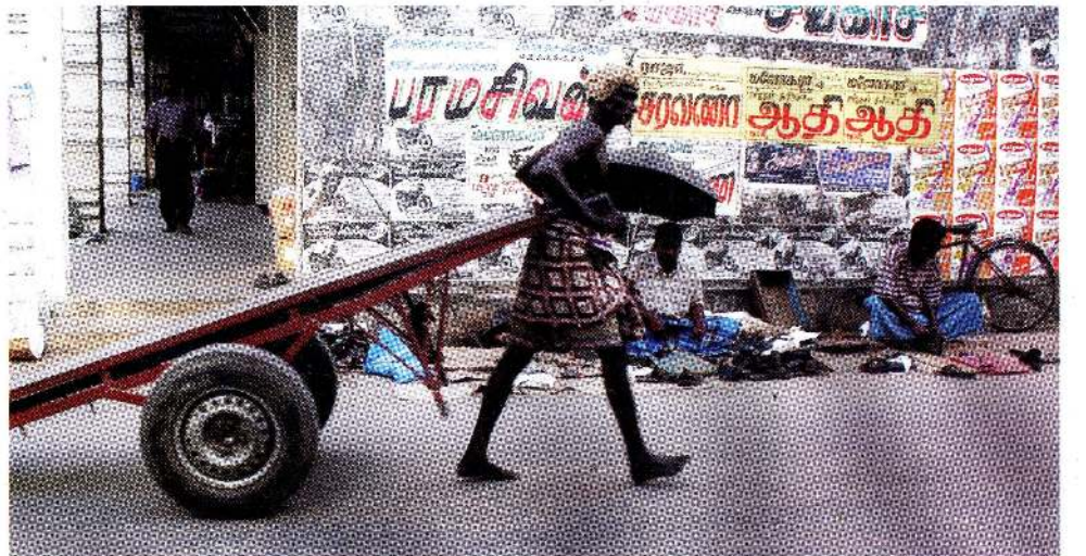
வீதியில் : பொதுவான சட்டத்தினடிப்படையில் ஊடகவியலாளர் நபரொருவரின் இனம், இனப்பிரிவு, மதம் போன்றவற்றை அறிக்கையிடலை தவிர்க்கல் வேண்டும். அது அவ் அறிக்கையின் தொடர்புடன் அதனை எவ்வாறு குறிப்பிட்டுத் தர வேண்டுமென அந்தநபரிடம் கலந்தாலோசிக்கவும்.