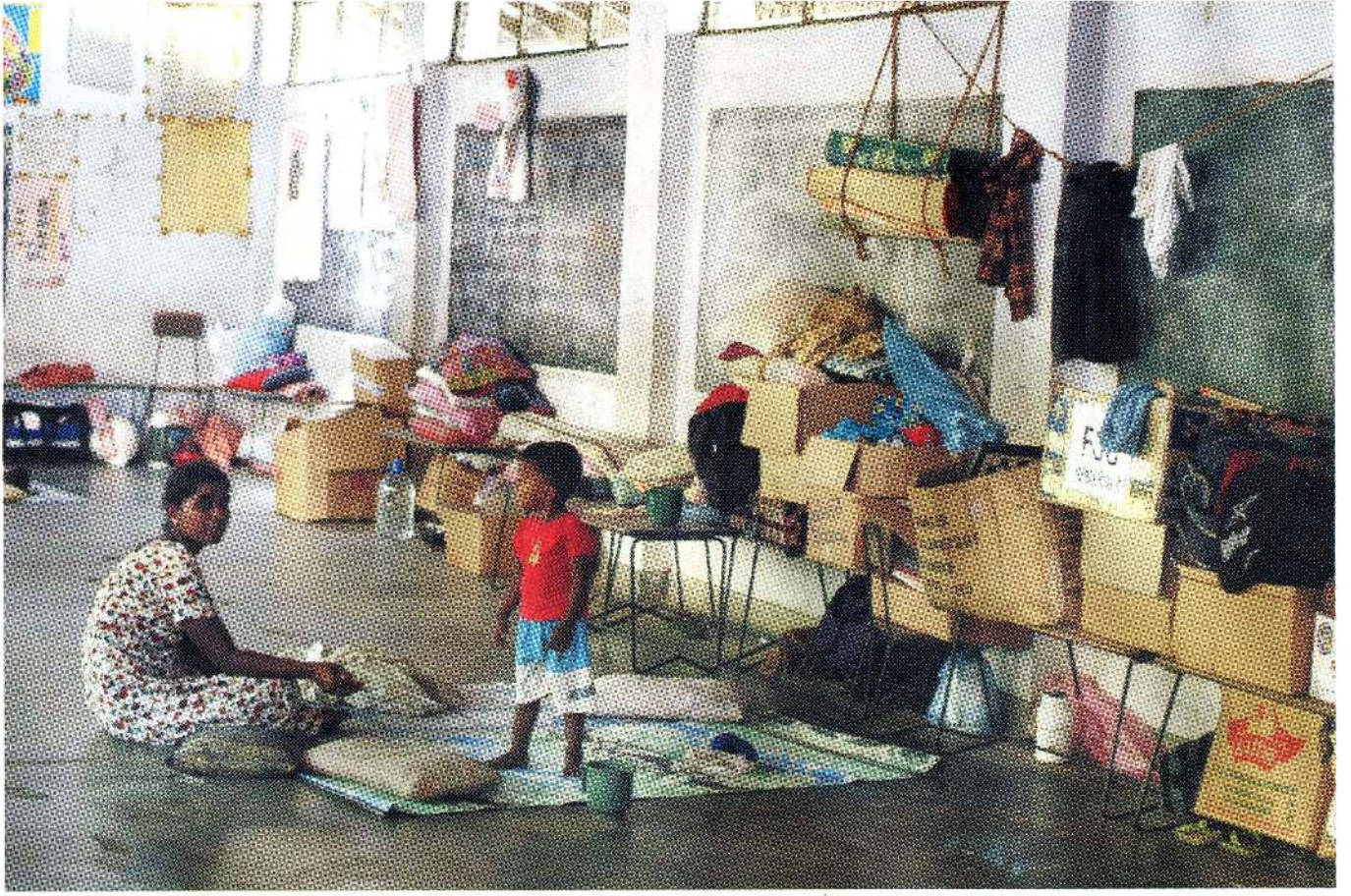
மறக்கப்பட்ட அகதிகள் : பொதுமக்கள் சேவை ஊடகவியல் பிரஜைகளின் முக்கிய விடயங்களை வெளிக்கொணர்வதன் பிரஜைகளின் தேவைகளுக்கும் முக்கியத்துவமளிக்கின்றது. பொதுமக்கள் சேவை துறையிலுள்ள ஊடகவியலாளரொருவருக்கு கல்வி, சுகாதாரம், சமூக சேவை போன்ற சமூக செயற்பாடுகளும் சிறந்ததொரு சந்தர்ப்பமாகும்.

உதாரணமாக கனடாவின் பின்பு ஊடகங்களிடமிருந்து மக்கள் எதனை எதிர்பார்த்தனர்? என்ன நடைபெற்றது என்பதை அறிய முற்பட்டனர் - “பிரச்சினை”,- அதேவேளை இதற்கு என்ன செய்யலாம் என்பதையும் அறிவதற்கு ஆவலாக இருந்தனர். - ‘தீர்வு’