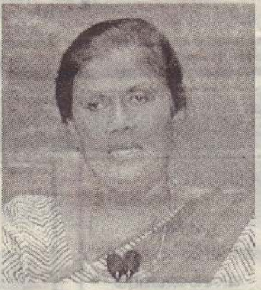
வேதனை அடைவதாகவும் தெரி வித்துள்ளார்.

பொருளாதார பாதிப்பு, என குறிப்பிட்டுக் கொண்டு அரச தலைவர்கள் சர்வதேசத்திடம் யாசகம் பெறுவதாக குற்றம் சாட்டியுள்ள அவர் தற்போதைய அவலநிலை கண்டு மன