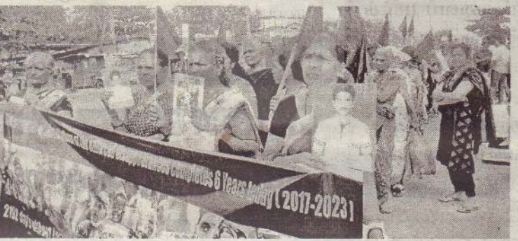
வலிந்து காணாமல் ஆக்கப்பட்டவர்களுக்கு நீதி கோரி கிளிநொச்சியில்

ஆரம்பிக்கப்பட்ட போராட்ட மானது நேற்றுடன் ஆறு ஆண்டுகள் நிறைவடைந்து