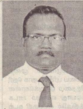
தமது பணிபுடன் மட்டும் நின்று விடாமல் மக்களுக்கான மனிதாபிமான செயற்பாடுகளிலும் ஈடுபடவேண்டும் என அவர் தெரிவித்தார். (4-33)

அலுவலக உத்தியோகத்தர்களோ ஆசிரியர்களோ வேறெந்த துறைசார்ந்தவர்களோ