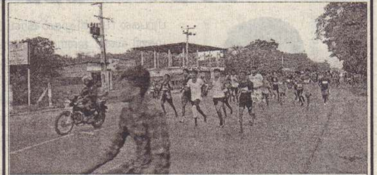
தருமபுரம் மத்திய கல்லூரியின் வருடாந்த இல்ல மெய் வல்லுநர் போட்டியின் முதல் நிகழ்வான மரதன் ஓட்ட நிகழ்வு நேற்று முன்தினம் நடைபெற்றது. தருமபுரம் மத்திய கல்லூரி முன்றலில் ஆரம்பிக்கப்பட்டு தேராவில் சந்தி வரை சென்றடைந்து அங்கிருந்து மீண்டும் தருமபுரம் மத்திய கல்லூரியை வந்தடைந்தது.

இந்த நிலையில் சர்வதேச கால்பந்தில் இருந்து ஓய்வு பெறுவதாக செர்ஜியோ ராமோஸ் அறிவித்துள்ளார். இது தொடர்பாக அவர் வெளியிட்டுள்ள பதிவில், “எனது நாட்டை 180 முறை பெருமையுடன் பிரதிநிதித்துவப்படுத்திய சிறப்புரிமை பெற்ற நபராக, உணர்ச்சியுடன் நான் வீட்டில் இருந்து தொடர்ந்து உற்சாகப்படுத்துவேன். என்னை எப்போதும் நம்பியிருக்கும் உங்கள் அனைவருக்கும் என் இதயத்தின் ஆழத்தில் இருந்து நன்றி என தெரிவித்துள்ளார். (நி)