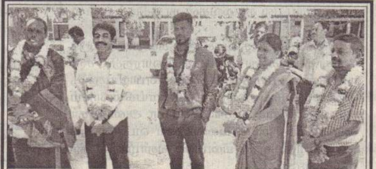
கிளிநொச்சியில் இயற்கை விவசாய அறிமுக ஊக்குவிப்பு மற்றும் இலவச பயிற்சியும் நேற்றுக்காலை சோலைவனம் விருந்தினர் விடுதியில் நடைபெற்றது.

கிளிநொச்சி மாவட்டத்தில் உள்ள மிகவும் பின்தங்கி உள்ள பகுதியில் போக்குவரத்து நெருக்கடிகளுக்கு மத்தியில் வேரவில் பிரதேச மருத்துவமனையினை நம்பி பல குடும்பங்கள் உள்ளமை குறிப்பிடத்தக்கது. (4-350)