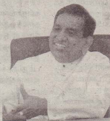
கள் இல்லாத ஒருமித்த முடிவை எடுக்கவேண்டும் - என்றார். (அ-ஒ,22)

ஜனாதிபதி ரணில் விக்ரமசிங்க தலைமையில் நடைபெற்ற சர்வகட்சிக் கூட்டங்களில் நானும் பங்கேற்றேன். அரசியல் தீர்வு வேண்டும் என்பதில் அனைத்துக் கட்சியினரும் ஒருமித்த நிலைப்பாட்டில் உள்ளனர். இது வரவேற்கத்தக்கது. ஆனால், அதிகாரப் பகிர்வு தொடர்பில்தான் ஒவ்வொரு கட்சியினரும் வெவ்வேறு நிலைப்பாடுகளில் உள்ளனர். ஜனாதிபதி கூறியதுபோல் அதிகாரப் பகிர்வு தொடர்பில் நாடாளுமன்றத்தைப் பிரதிநிதித்துவப்படுத்தும் கட்சிகள், முரண்பாடு