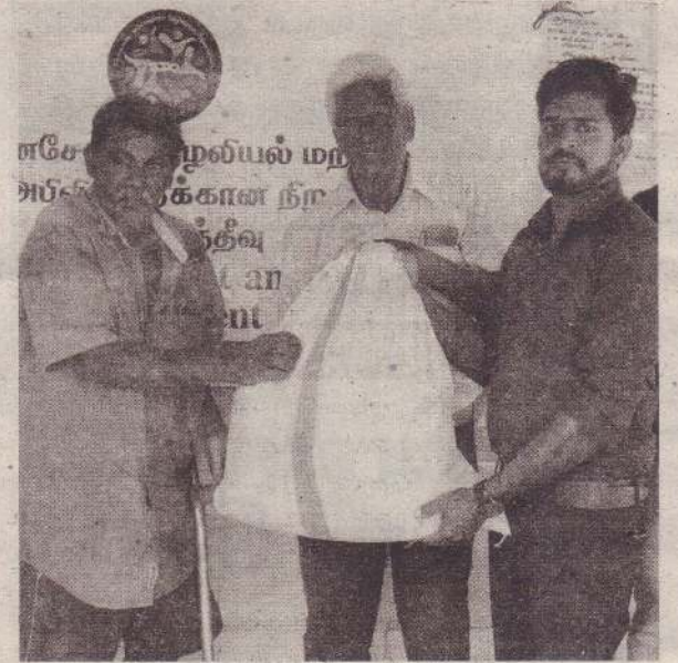
குழலியல் மற்றும் சமூக அபிவிருத்திக்கான நிறுவனத்தினால் முல்லைத்தீவு மாவட்டத்தில் தெரிவுசெய்யப்பட்ட 50 குடும்பங்களுக்கு உலர் உணவுப்பொதிகள் கடந்த வெள்ளிக்கிழமை வழங்கப்பட்டன. (ம-14-19)