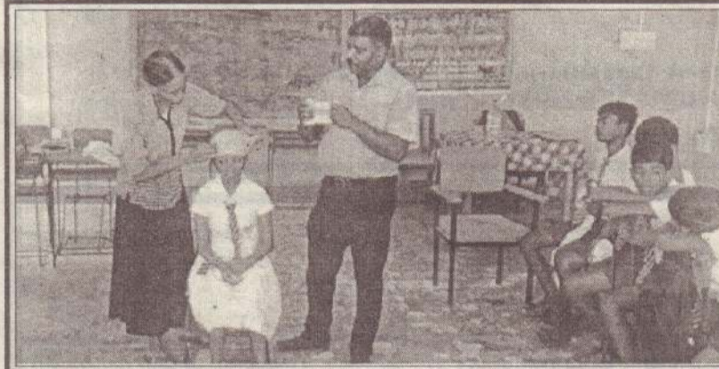
இலங்கை முதல்தவிச் சங்கத்தினரால் கொடிகாமம் மத்திய கல்லூரி மாணவர்களுக்கு மூன்று நாள் முதல்தவிப் பயிற்சி வழங்கி வைக்கப்பட்டுள்ளது.

ள்ளது. இது தொடர்பாக நெல்லியடி பொலிஸார் மேலதிக விசாரணைகளை மேற்கொண்டுள்ளனர். அண்மைய நாட்களாக வடமராட்சி பகுதியில் கொள்ளை மற்றும் திருட்டுச் சம்பவங்கள் இடம்பெற்று வரும் நிலையில் பொலிஸார் மற்றும் நீதித்துறை இது தொடர்பில் கவனம் செலுத்த வேண்டும் என பொதுமக்கள் கோருகின்றனர். (4-6-60)