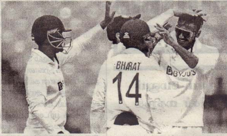
ஓட்டங்களும் கே.எஸ்.பரத் 44 ஓட்டங்களும் எடுத்தனர். 91 ஓட்டங்கள் பின்தங்கிய நிலையில் 2 ஆவது இன்னிங்ஸை விளையாடிய அவுஸ்திரேலியா அணி 4 ஆம்

இந்தியா-அவுஸ்திரேலியா அணிகள் இடையிலான 4 ஆவது மற்றும் கடைசி டெஸ்ட் போட்டி அகமதாபாத்தில் நடைபெற்றது. முதல் இன்னிங்ஸில் அவுஸ்திரேலியா 480 ஓட்டங்கள் குவித்தது. பின்னர் முதல் இன்னிங்ஸை விளையாடிய இந்திய அணி 571 ஓட்டங்கள் குவித்து ஒல்-அவுட் ஆனது. நிதானமாக ஆடிய விராட் கோலி 186 ஓட்டங்கள் எடுத்தார். சுப்மன் கில் 128 ஓட்டங்களும் அக்ஷர் படேல் 79