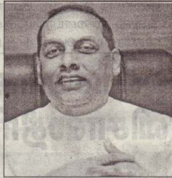
செலுத்தியுள்ளது எனத் தெரிவித்துள்ளார். (நி)

அத்துடன் பண்டி உரத்தின் விலை உயர்மட்டத்தில் உள்ளதால் அந்த உரத்தின் விலையை 10,000 ரூபாவாக குறைப்பது குறித்து அரசாங்கம் கவனம்