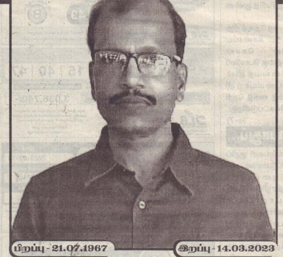
பிறப்பு - 21.07.1967 இறப்பு - 14.03.2023