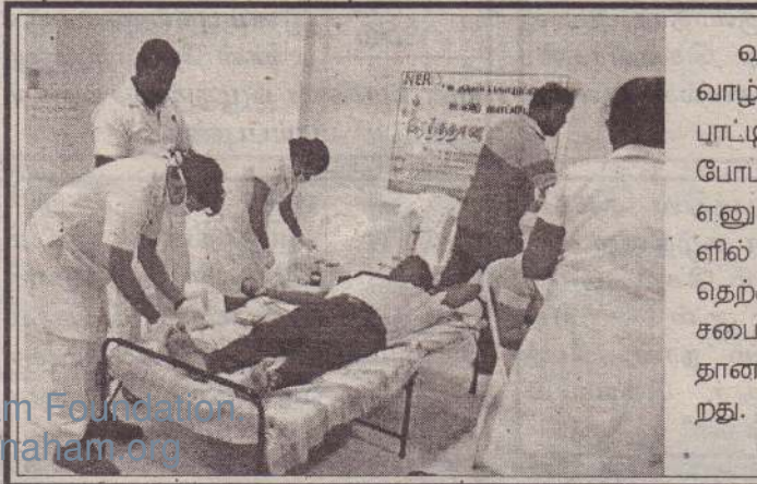
வடக்கு-கிழக்கு புனர்வாழ்வு அமைப்பின் ஏற்பாட்டில் 'உதிரம் கொடுப்போம் உயிர் காப்போம்' எனும் தொனிப்பொருளில் நேற்று வடமராட்சி தெற்கு, மேற்கு பிரதேச சபை மண்டபத்தில் இரத்தான முகாம் நடைபெற்றது.

ஆம் திகதி திங்கட்கிழமை இடம்பெறவுள்ளது. எண்ணெய்க் காப்பு சாத்தும் நிகழ்வு 25 ஆம் திகதி சனிக்கிழமை தொடக்கம் அடுத்த நாள் ஞாயிற்றுக்கிழமை மாலை 6.30 மணிவரை இடம்பெறும். மறுநாள் திங்கட்கிழமை காலை 9.40 தொடக்கம் 10.20 மணிவரையுள்ள சுபவேளையில் மஹா கும்பாபிஷேகம் இடம்பெறும். (நி-6)