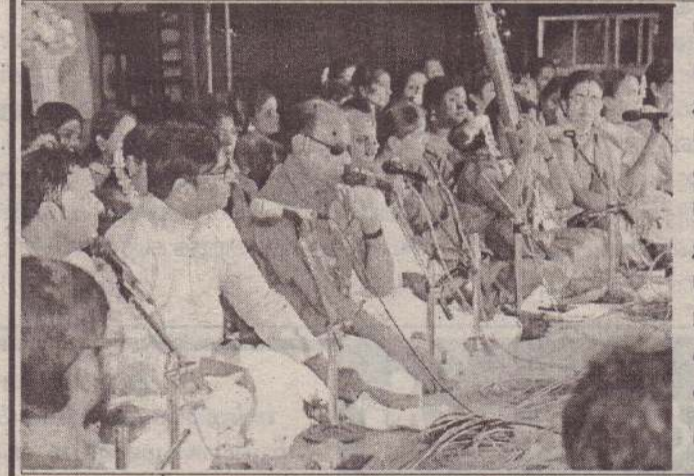
யாழ். இந்தியத் துணைத் தூதரகத்தால் ஏற்பாடு செய்யப்பட்டிருந்த சற்குரு ஸ்ரீ தியாகராஜ சுவாமிகளின் இசை ஆராதனை நிகழ்வு யாழ்ப்பாண கலாசார மத்திய நிலையத்தில் கடந்த சனிக்கிழமை இடம்பெற்றது.