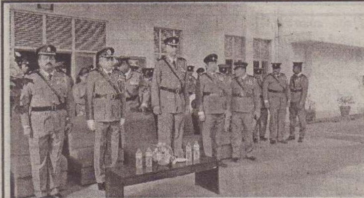
159 வருட பொலிஸ் வீரர் தினம் யாழ்ப்பாணத்தில் நேற்று இடம்பெற்றது. கடமையின்போது உயிரிழந்த பொலிஸ் உத்தியோகத்தர்களை நினைவுகூரும் வகையில் குறித்த நிகழ்வில் யாழ்ப்பாணம் பொலிஸ் தலைமையகத்தில் நேற்று செவ்வாய்க்கிழமை இடம்பெற்றது.

இதனை விட கல்வி உண்கு விப்பு, மாணவர்களுக்கான சேமிப்புப் பழக்கத்தை உண்குவித்தல் உள்ளிட்ட பல்வேறு வேலைத்திட்டங்களை முன்னெடுத்து வருவதாக மேலும் அவர்கள் இதன்போது தெரிவித்தனர். (4-6-30)