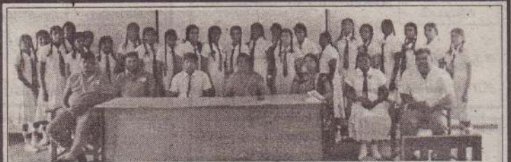
சுன்னாகம் பாரம்பரிய ரோட்டரிக் கழகத்தினால் நேற்று முன்தினம் திங்கட்கிழமை சுழிபுரம் விக்டோரியாக் கல்லூரியில் இடைவினைக் கழகம் அங்குரார்ப்பணம் செய்து வைக்கப்பட்டுள்ளது. குறித்த நிகழ்வில் சுன்னாகம் பாரம்பரிய ரோட்டரிக் கழக அங்கத்தவர்கள், பாடசாலையின் அதிபர், ஆசிரியர்கள் மற்றும் மாணவர்கள் பங்குபற்றியிருந்தனர். (புடம்-சுபேசன்)

குறித்த பகிரங்க ஏலத்தில் துவிச்சக்கர வண்டிகள், தொலைபேசிகள் மற்றும் இதர பொருட்கள் கொள்வனவு செய்யவர்கள் கொடுப்பனவுகளை பணமாகவே செலுத்த வேண்டும். காசோலை ஏற்றுக் கொள்ளப்படமாட்டாது. தமது தேசிய அடையாள அட்டையுடன் சமூகமளிக்க வேண்டும். அத்துடன் ஏலவிற்பனையில் பெற்றுக் கொள்ளும் பொருட்களை அன்றைய தினமே உடனடியாக வளாகத்திலிருந்து அகற்ற வேண்டும் என நீதிமன்ற நீதிவான் அறிவித்துள்ளார். (4)