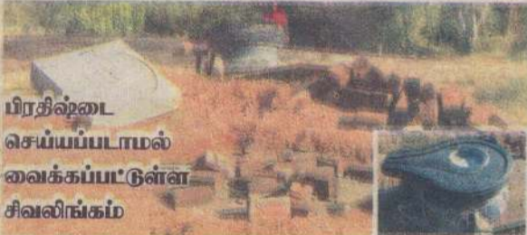
பிரதீஷ்டை செய்யப்படாமல் வைக்கப்பட்டுள்ள சிவலிங்கம்