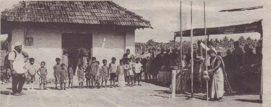
கிளிநொச்சி - தர்மபுரம் பகுதியில் அமைந்துள்ள ஆறுமுக நாவலர் முன்பள்ளியில் மழலைகளின் விளையாட்டு நிகழ்வு அண்மையில் இடம்பெற்றது. (அ-ய-113)