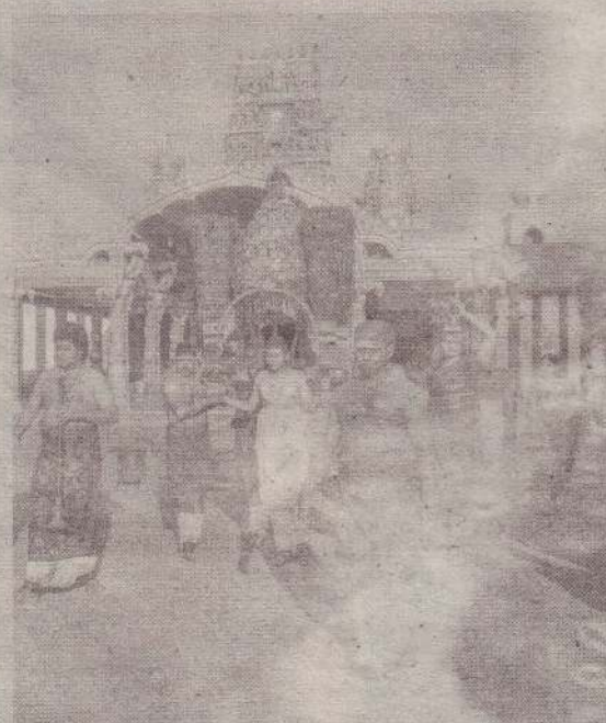
வரலாற்றுச் சிறப்புமிக்க நல்லூர் கந்தசுவாமி ஆலயத்தில் பங்குனி உத்தர பால் காவடி பவனி நேற்றுப் புதன்கிழமை பக்தி பூர்வமாக இடம் பெற்றது. (ஒ-14)

வீதியில் பயணித்த மோட்டார் சைக்கிளின் பன்றி மோதி அதில் பயணித்த நபரின் காலைக் கிழித்துள்ளது. இந்தச் சம்பவம் பூநகரியில் நேற்றுமுன்தினம் செவ்வாய்க்கிழமை அதிகாலை 2 மணிக்கு இடம்பெற்றது. வேட்டைக்காரர்களால் துரத்தப்பட்ட பன்றி வீதியை குறுக்கறுத்துச் சென்றது. அதன் போது அந்த வழியே பயணித்த மோட்டார் சைக்கிளின் மோதியதில் பயணித்தவரின் காலைக் கிழித்தது. பன்றியின் தாக்குதலில் மோட்டார் சைக்கிளில் பயணித்தவர் கால் முறிந்த நிலையில் வீதியில் விழுந்து காணப்பட்டார். அவரை யாழ்ப்பாணம் நோக்கி வாகனத்தில் பயணித்தோர் ஏற்றிச் சென்று சாவகச்சேரி மருத்துவமனையில் சேர்த்தனர். அதன்பின்னர் நபர் மேலதிக சிகிச்சைக்காக யாழ்ப்போதனா மருத்துவமனைக்கு மாற்றப்பட்டார். (ஒ-14,9)