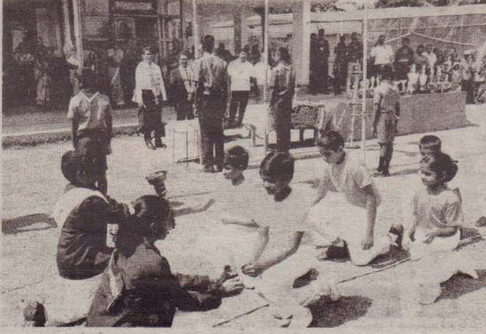
யாழ். இந்து ஆரம்ப பாடசாலையின் செயற்பட்டு மகிழ்வோம் வருடாந்த விளையாட்டு விழா யாழ். இந்து கல்லூரி மைதானத்தில் அண்மையில் இடம் பெற்றது. (அ-ய-125)