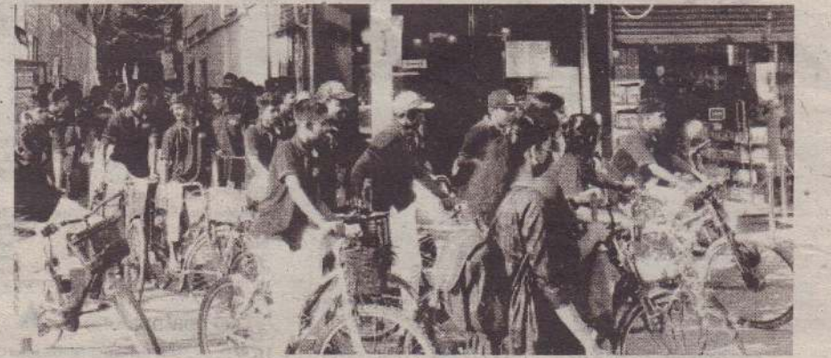
வட்டுக்கோட்டை யாழ்ப்பாணக் கல்லூரியின் 200வது ஆண்டு நிறைவை முன்னிட்டு வட்டுக்கோட்டை யாழ்ப்பாண கல்லூரியினரால் விசேட சைக்கிள் பவனி கடந்த 24ஆம் திகதி வெள்ளிக்கிழமை இடம்பெற்றது. (அ-ய-125)

திவானூரன் Noolaham Foundation noolaham.org | aavaahan.org