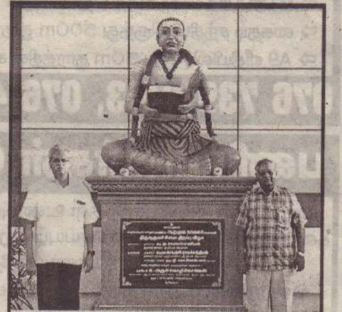
சென்னையில் நாவலர் பெருமானின் திருவுருவச்சிலை நேற்று திறந்து வைக்கப்பட்ட போது...

இதனால் நாட்டின் அரசியலமைப்புச் சட்டத்தினால் மக்களுக்கு வழங்கப்பட்டுள்ள மனித உரிமைகள் கூட மீறப்படுவதாக எதிர்க்கட்சித் தலைவர் சஜித் பிரேமதாஸ் தெரிவித்தார். (ம-7,9)