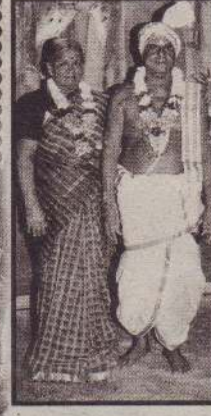
அம்மன் கோவில் உடுவில்.