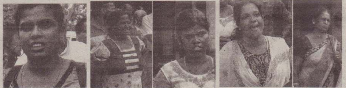
உதயனுக்குள் காட்டுமிராண்டித்தனமாக அடடுழியல் செய்த கும்பலைச் சேர்ந்த சிலர்