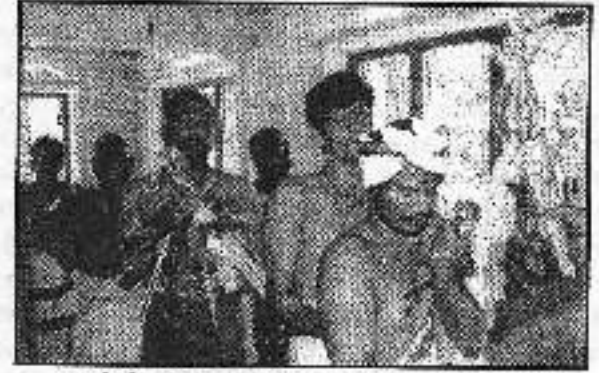
ஆத்மீக சேவை சங்கப்பாட்டுக்கல்வி நிகழ்வு

இயற்கையிலும், பன்வேறு அளவுத்துவங்களினாலும் துன்ப, துயரங்களுக்குள்ளாகி, வறுமைக்குள்ளான குடும்பங்களை அடையாளம் கண்டு, அவர்களைப் பொருத்தமான விழிப்புணர்வுட்டல், ஒன்றிணைத்தல், உற்சாகப்படுத்தல் முதலான செயற்திட்டங்களின் மூலமாக மன உறுதிப்பாடுடையவர்களாகவும், தன்னம்பிக்கை உடையவர்களாகவும், ஒற்றுமை உடையவர்களாகவும் ஆக்கி, அவர்களின் விருப்பங்களையும் அறிந்து, அதற்கேற்றவாறு உயதொழில் முயற்சிகளில் ஈடுபடுத்துவதும், அவர்களுக்குத் தேவையான நலனை தொழிநுட்ப பயிற்சிகளையும், தொழிற்செயற்பாட்டிற்குத் தேவையான உடன்களையும் வழங்குவது. அதனைத் தொடர்ந்து அவர்களைக் கண்காணித்தல். மகிப்பிடு செய்தல், நிச்சயமான வருமானத்தைப் பெற ஈக்குவித்தல் முதலான தொர் சேவைகளை மேற்கொள்வது. இதன்வாயிலாக அவர்கள் ஈர் ஈர் அபிவிருத்திப்பையும், இடைக்கால அபிவிருத்தியையும், நிலைபெண் அபிவிருத்திப்பையும் படிப்படியாகப் பெறுவதை உறுதிப்படுத்தல். மக்கள் தங்கள் பொந்த முயற்சியினாலே தேடிக்கொள்ளும் மேலதிக வருமானத்தின் உதவியுடன் அவர்களுக்குத் தேவையான அக்சியாவலிய தேவைகள் அனைத்தையும் முறைமேற்றிக் கொள்வதையும், அதன் வாயிலாக தங்கள் வாழ்க்கைத்தரத்தை உயர்த்திக் கொள்வதையும் மேற்பாடு செயற்பாடுகள் நிச்சயப்படுத்தும்.