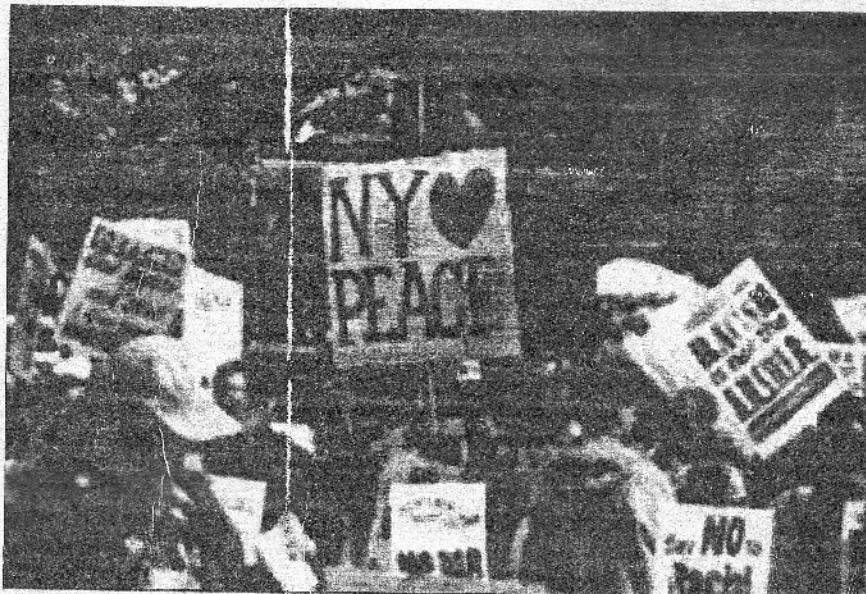
அமெரிக்கா ஈராக்கிற்கு எதிராக முன்னெடுக்கவுள்ள யுத்தத்திற்கு எதிராக அமெரிக்க வாஷிங்டன் நகரில் இடம்பெற்ற ஆர்ப்பாட்டம்

ஐ.நாவின் பொறுப்பின் மீறத்தகாத்தன்மை பற்றிய புஷ்ஷின்