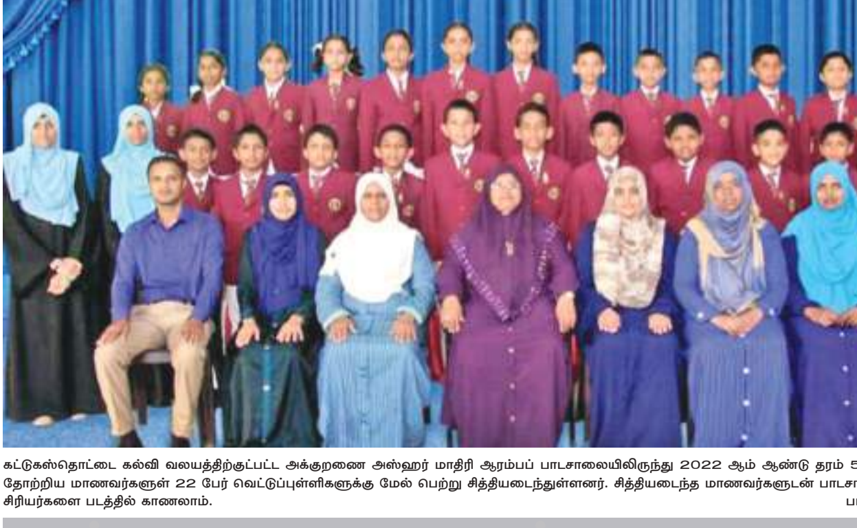
கட்டுக்கலாநாட்டை கல்வி வலியுறுத்தும் பட்ட அக்குரண அன்ஹர் மாநில ஆரம்ப பாடசாலையிலிருந்து 2022 ஆம் ஆண்டு தரம் 5 புலமையறிசில் பரீட்சைக்கு தோற்றிய மாணவர்களுள் 22 பேர் வெட்டுப்புள்ளிகளுக்கு மேல் பெற்று சித்தியடைந்துள்ளனர். சித்தியடைந்த மாணவர்களுடன் பாடசாலை அதிபர் மற்றும் வகுப்பாசிரியர்களை படத்தில் காணலாம்.

பொருளாதார நெருக்கடி காரணமாக இரத்தினபுரி மாவட்ட தோட்டமாணவர்களுக்கு உதவியாக அனுபவித்து வருகின்றனர். இதன் காரணமாக பெரும்பாலான இன்று தொடக்கம் வாரத்தில் இரு நாட்கள் பகலுணவு வழங்கப்படும். இதற்கென நான் ஒன்றுக்கு மட்டும் கமார் இரண்டு இலட்சம் ரூபாய் செலவிடப்படுகிறது என்றார்.