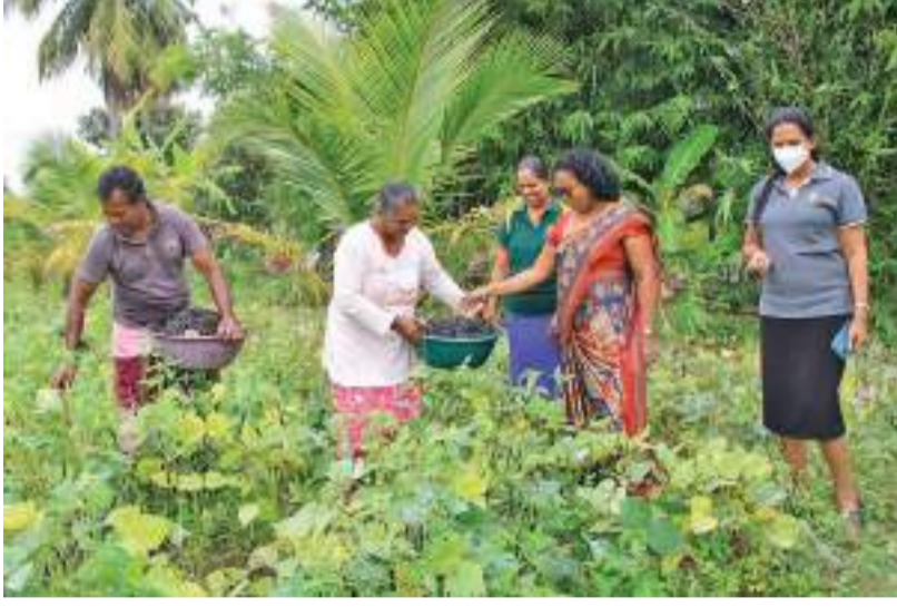
விதைகளும் இலவசமாக விவசாயிகளுக்கு விநியோகிக்கப்பட்டன. இவ் விதைகள் அனைத்தும் விவசாய திணைக்களத்தின் மகா இலுப்பள்ளத்தில் உள்ள விதை மற்றும் நடுகைப் பொருள் பண்ணையில் இருந்து கொள்முதல் செய்யப்பட்டதால் இதன் வளர்ச்சி வெற்றியடைந்ததாக இந்தத் திட்டத்தின் ஒருங்கிணைப்பாளர் மாவட்ட விவசாய இயக்குநர் குறிப்பிட்டுள்ளார். ஆனால், தற்போது பூச்சிக் கொல்லி மருந்து இல்லாததால், இரசாயன உரங்களின் விலை உயர்வதாலும் குறிப்பிட்ட வயல்களில் எதிர்பார்த்த விளைச்சல் கிடைக்காமல் போகக்கூடிய வாய்ப்பு உள்ளதாகவும் தெரிவிக்கப்படுகின்றது.