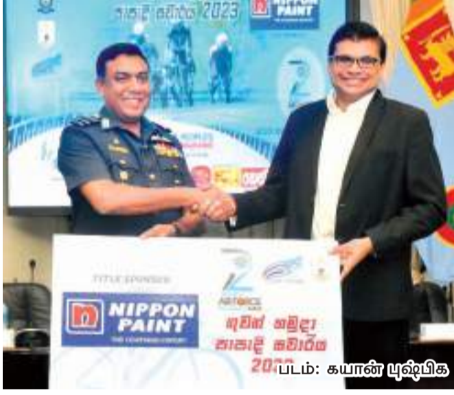
படம்: கயான் யூஷ்பிசு வரையும் மகனிர் பிரிவில் 35 வீரர்கள் வரையும் பங்கேற்பார்கள் என்று எதிர்பார்க்கப்படுகிறது. இந்தப் போட்டியில் ஆட்வர் பிரிவில் பெறுபவருக்கு 400,000 ரூபா மற்றும் மகனிர் பிரிவில் முதலிடம் பெறுபவருக்கு 100,000 ரூபா பரிசு வழங்கப்படவுள்ளது.

இலங்கை விமானப் படையின் 72 ஆவது ஆண்டு நிறைவுக்கு இணையாக 24 ஆவது முறையாக விமானப் படை சைக்கிளோட்டப் போட்டி வரும் மார்ச் 2, 3 மற்றும் 4 ஆம் திகதிகளில் நடைபெறவுள்ளது. இலங்கை சைக்கிளோட்ட சம்மேளனத்துடன் இணைந்து இலங்கை விமானப் படையால் ஏற்பாடு செய்யப்பட்டிருக்கும் விமானப்படை சைக்கிளோட்டப் போட்டிக்காக "நிப்பொன் பெயின்ட்" நிறுவனம் பிரதான அனுசரணை வழங்குவதோடு அபான்ஸ், மெலிபன் மற்றும் டெலிகொம் மொபிடெல் நிறுவனங்கள் இணை அனுசர வழங்குகின்றன. இலங்கையின் முன்னணி சைக்கிளோட்டப் போட்டியாக மாறியிருக்கும் விமானப் படை சைக்கிளோட்டப் போட்டி ஆட்வர் மற்றும் மகனிர் இரு பிரிவுகளிலும் நடைபெறவுள்ளது. இதில் மூன்று நாட்கள் நடைபெறும் ஆட்வர் பிரிவு போட்டிகள் கொழும்பில் ஆரம்பித்து அநுராதபுரத்தில் நிறைவடையவுள்ளது. போட்டியின் மொத்த தூரம் 396 கி.மீ.நிறுத்தப்படும். மகனிர் போட்டி ஒரு நாளைக்கு மட்டுப்படுத்தப்பட்டு இடம்பெறவுள்ளது.