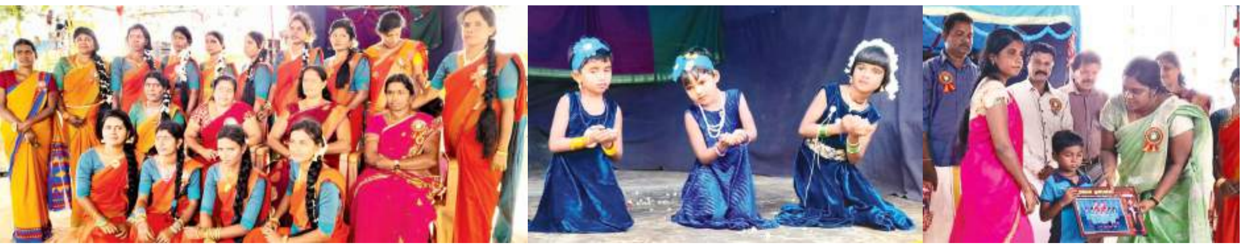
அணைத்துலக மருத்துவநல அமைப்பு, மற்றும் றட்டன் பன்னாட்டு அணுசரணியில் கிளிநொச்சி வடக்கு கல்விவலயம், ஆரம்ப முன்பிள்ளைப்பருவ அபிவிருத்திப் பிரிவின் முழு நிளை நாள விழா மிகவும் சிறப்புற நடைபெற்றது. இந்நிகழ்வுக்கு 300ற்கும் மேற்பட்டவர்கள் வருகை தந்திருந்தனர். முழு நிளை நாள நிகழ்வில் அரங்கநிகழ்வுகளாக குழந்தைகளின் கலைநிகழ்வுகள், ஆசிரியர்களின் கலைநிகழ்வுகள் என்பன இடம்பெற்றமை குறிப்பிடத்தக்கது.

எரியூட்ட அனுமதிக்க முடியாது என தெரிவிக்கப்பட்டது. இந்நிலையில் கடந்த இரண்டு நாட்களாக யாழ்.போதனை வைத்தியசாலையில் மருத்துவ கழிவுகள் வெளியேற்றப்படாது லொரிகளில் ஏற்றப்பட்டு வைத்தியசாலை வளாகத்தில் தேங்கிக் கிடப்பதாக வைத்தியசாலை தகவல்கள் தெரிவிக்கின்றன.