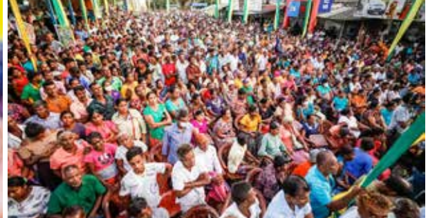
தற்போதைய ஜனாதிபதி ரணில் விக்கிரமசிங்க மொட்டுக்கு வழங்கிய மூன்று வாக்குறுதிகள் தொடர்பில் எதிர்க்கட்சித் தலைவர் சஜித் பிரேமதாஸ அம்பலப்படுத்தியுள்ளார்.