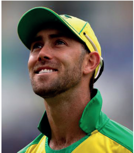
இந்தியாவுக்கெதிரான ஒருநாள் சர்வதேசப் போட்டிக் தொடருக்கான

தரவரிசை பின்வருமாறு, மர்னூஸ் வபுஷைன், 2. ஸ்டீவ் ஸ்மித், 3. பாப் அஸாம், 4. ட்ரெவின் ஹெட், 5. ஜோ ஹாட், 6. ரிஷப் பண்ட், 7. ரோஹித் ஷர்மா, 8. கேன் வில்லியம்ஸன், 9. திமுத் கருணாரத்ன, 10. உஸ்மான் கவாஜா. இதேவேளை மேற்படி டெஸ்டில் 74 ஓட்டங்களைப் பெற்ற இந்தியாவின் அக்ஸர் பட்டேல், ஏழாமிடத்திலிருந்து இரண்டு இடங்கள் முன்னேறி ஐந்தாமிடத்தையடைந்தார். முதல் ஐந்து சகலதுறைவீரர்களின் தரவரிசை பின்வருமாறு, இரவிந்திர ஜடேஜா, 2. இரவிச்சந்திரன் அஷ்வின், 3. ஷகீப் அல் ஹஸன், 4. பென் ஸ்டோக்ஸ், 5. அக்ஸர் பட்டேல்.