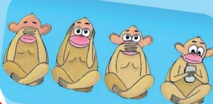
குணங்களையும் மொத்தமாக கொண்டுள்ளது...

கொஞ்சம் இடைபட்டாலமக நான்காவதாக ஒரு குரங்கு மற்ற ஒன்று குரங்குகளுடன் இடம்பிடித்துள்ளது. அப்படி என்ன அந்த குரங்கும் அதுதான். இது மற்ற ஒன்று குரங்குகளின் குணங்களையும் மொத்தமாக கொண்டுள்ளது... அது ஸ்டாபிளர்ஷ் கேக்கிங்கா...? யானையும் பாக்காது! யா பேசுமையும் கேட்கேது! யாட்டும் சொது! தனியா உட்கார்ந்து கொடுப்பான் ரோஷங்கிட்டிருக்கும்!