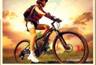
சுபா பார்டில் எத்தகும் இவன் சலையெய்யத்து இல்லை... பாக்கிசு கட்டணத்து பெருசா ஸ்கெயும் செலுத்த மாட்டான்... இவ்வளவு போய்த் தொலையட்டுமனு உட்டான்... இவ்வளவு கல் வராது... இதய நோய் வராது... குண்டாக்கம் மாட்டான்... ஆவலத்திரி, பட்டம், மருந்து கடை இவ்வளவு இவ்வளவுத் தேவையே இல்லை... உலகம் பெருகாததான் வளர இவன் எதுவும் செய்ய மாட்டான்.

தன்மும் கைக்கிள்ளி இவ்வளவு விசயம் இருக்கா...? தன்மும் உலகம் பெருகாததான் சிறிது... ஆச்சரியமா இருக்கா? நொடர்ந்து படிக்க... ஏன்னை அவன் கா வாங்க மாட்டான்... அதற்காக உடன் வாங்கவும் மாட்டான்... வட்டியும் கட்ட மாட்டான்... போகக் கணினால் கம்பனிக்கு சலிவிட மாட்டான்... கா இவ்வளவு பணத்துக்கு வர மாட்டான்... இந்த பெருமேல் கல்... மஹும்... வாப்பே இல்லை... இவ்வளவு அம்மரிக்கா, சவுதி அநேயியவுக்கும் கூட எந்த பயமும் இல்லை... சர்வீஸ்