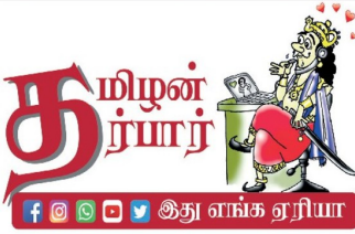
அது எங்க ஏரியா

இயற்கையாக எளிமையாக இலக்கணத்தின் செழுமையாக இடர்களின்றிய ஒலியாக அமைந்திட்ட எம் தாய்மொழியை இதயத்தின் துடிப்பாயெண்ணிப் போற்றுசிறோம் ஆழ்ந்தகன்று அதைக்கற்றிடவே தேடுசிறோம் நானிலத்தில் உன்னமிழ்தம் அருந்திட விளைகின்றோம் நித்தியமாயுள் பெருமை ஓங்கிட வாழ்த்துகிறோம் நயங்குன்றாத தாயதமிழ் வளர்கவே நனிசிறந்த நல்மொழியே நீ வாழ்கவே Dr ஜகலா முலம்மில் ஏறாவுர்