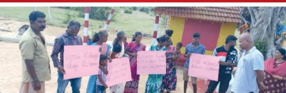
தொடர்பாக அறிந்து ஆயவ நிரவகத்தின் கைத்திற்கு தெரிவிப்படுத்தியிருந்தனர். அதன் பின்னர் ஆயவ நிரவகம் குறித்து சம்பவம் தொடர்பாக வாழைச்சேனை பொலிஸ் நிலையத்தில் முறையாக புகார் செய்திருந்தனர். சம்பவம் தொடர்பாக கிராமத்தை சேர்ந்தவர்கள் தெரிவிக்கின்றனர்.

(வரலாற்றுசான்ற செய்தி) மட்டக்களப்பு - கொழும்பு வீதிப்பின் அருகே வாகனோரி ஆலயத்தில் அமைந்துள்ள வெள்ளை நிற ஆலயத்தில் இருந்து கைவிடப்பட்ட பொருட்கள் சில அடையாளத்தின்படி நபர்களிடம் சேதமாக்கப்பட்டன. ஆயத்திகள் கூட்டத்தில் சில பகுதிகள் சேதமாக்கப்பட்டுள்ளதால் பிரதேச மக்கள் குறித்து செப்தம்பாட்டிற்கு கண்டன தெரிவிக்கும் குற்றவாளிகளை கைது செய்யுமாறு கோரியும் கனடாப்பட்டு பொருட்கள் சேதமுற்றதன்மீது தெரிவித்துள்ளனர். இந்த ஆயத்திக்கு சென்ற ஆயத்தி தலைவர், அங்கு இடம்பெற்றிருந்த மேற்படி தடயவியல்