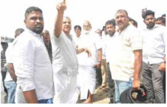
பாதிக்கப்படும் எனவும் இன்னொரு தரப்பினால் கடற்றொழில் அமைச்சரின் கவனத்திற்கு கொண்டு வரப்பட்டிருந்தது. இந்நிலையில், சம்பந்தப்பட்ட பகுதிக்கு அதிகாரிகள் சகிதம் விஜயம் மேற்கொண்ட அமைச்சர் டக்ளஸ் தேவானந்தா, நிலைமைகளை நேரடியாக ஆராய்ந்ததுடன் பிரதேச மக்களின் கருத்துக்களையும் கேட்டறிந்து கொண்டார். (அ)

கொழும்பு, பெப். 26 நீர்கொழும்பு களப்பு ஆழப்படுத்தும் செயற்பாடுகள் உரிய ஆய்வுகளின் அடிப்படையில், எந்தத் தரப்பினரையும் பாதிக்காத வகையில் மேற்கொள்ளப்படும் என்று அமைச்சர் டக்ளஸ் தேவானந்தா தெரிவித்தார். நீர்கொழும்பு களப்பின் 'யக்கா வங்குவ' எனும் பகுதியை பார்வையிட்ட பின்னர் அவர் மேற்கண்டவாறு தெரிவித்தார்.