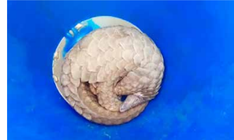
பொலிஸார் தெரிவித்தனர். அழுங்கு எனப்படும் அரியவகையான காட்டு விலங்கினம் முல்லைத்தீவு மாவட்ட பாரிய வனங்களில்

முல்லைத்தீவு, பெப். 26 முல்லைத்தீவு மாவட்டத்தின் கொக்குளாய் பகுதியில் உள்ள வீடு ஒன்றிற்குள் அரியவகை காட்டு விலங்கினமான அழுங்கு எனப்படும் விலங்கினம் புகுந்துள்ளது. வீட்டின் உரிமையாளர்கள் அவசர தொலைபேசி இலக்கத்துக்கு அழைப்புக்கு தகவல் கொடுத்துள்ளதை தொடர்ந்து குறித்த வீட்டுக்கு சென்ற கொக்குளாய் பொலிஸார் குறித்த விலங்கினத்தினை பத்திரமாக மீட்டு பொலிஸ் நிலையம் கொண்டு சென்றுள்ளனர். குறிப்பிட்ட அழுங்கினை வனஜீவராசிகள் திணைக்களத்திடம் ஒப்படைக்க நடவடிக்கை எடுக்கப்பட்டுள்ளதாக கொக்குளாய்