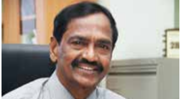
தினம் நடைபெறாது என தேர்தல்கள் ஆணைக்குழு அறிவித்துள்ளது. தேர்தல்கள் ஆணைக்குழு வின் கட்டுப்பாட்டுக்கு அப்பாற்பட்ட விடயங்கள் காரணமாக உரிய தினத்தில் வாக்கெடுப்பை நடத்த முடியாது என சுட்டிக்காட்டி யிருந்தமை குறிப்பிடத்தக்கது. (அ)