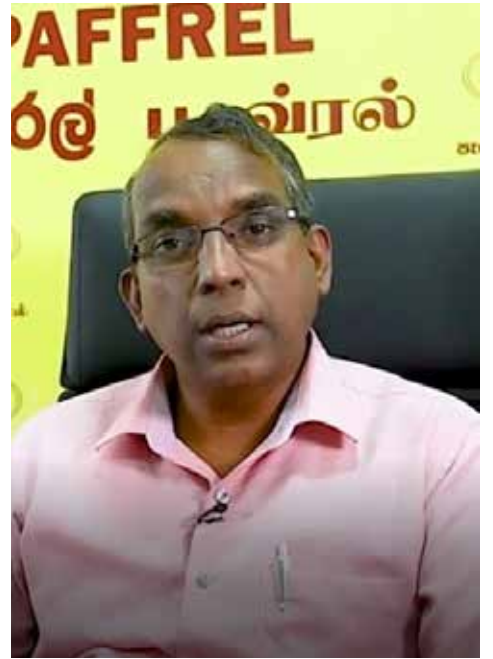
இந்த பணத்தை வீணடித்தமைக்கான பொறுப்பை அரசியல் தலைமையும் அரசாங்க அதிகாரிகளும் ஏற்பார்களா? எனவும் கேள்வி எழுப்பியுள்ளார்.

தேர்தல் தொடர்பான விடயங்களுக்காக ஏற்கனவே 50 கோடிக்கு மேல் செலவிட்டுள்ளனர். இது பொதுமக்களின் பணம் என குறிப்பிட்டுள்ள பவ்ரலின் நிறைவேற்று பணிப்பாளர், தேர்தல் நடைபெறாவிட்டால்