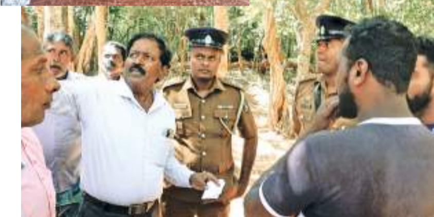
கையைச் சார்ந்த சிலரும் ஈடுபட்டிருந்தனர்.

இந்நடவடிக்கைக்கு எதிர்ப்புத்தெரிவித்து நாம் ஆர்ப்பாட்டத்திலும் ஈடுபட்டிருந்தோம்.