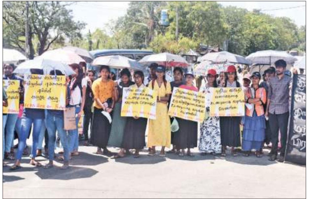
திருகோணமலை பல்கலைக்கழக (Faculty of Communication & Business Studies) மாணவர்களால் பல கோரிக்கைகளை முன்வைத்து முன்னெடுக்கப்பட்ட கவனயீர்ப்பு ஆர்ப்பாட்டம் நேற்று வெள்ளிக்கிழமை (24) திருகோணமலை அபயபுர சுற்றுலாத்தலில் இடம்பெற்ற போது...

தமிழ் தேசியக் கூட்டமைப்பு மற்றும் தமிழர் விடுதலைக் கூட்டணி உறுப்பினர்களும் ஐக்கிய தேசியக் கட்சி மற்றும் மான் சுயேட்சைக் குழு உறுப்பினர்களும் 12 தமிழ் உறுப்பினர்கள் எதிர்த்து வாக்களித்திருந்தனர்.