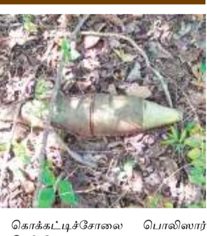
கொக்கட்டிச் சோலை பொலிஸார் தெரிவித்தனர். இச் சம்பவம் தொடர்பில் கொக்கட்டிச் சோலை பொலிஸார் மேலதிக விசாரணைகளை மேற்கொண்டு வருகின்றனர்.

விசேட அதிரடிப்படையினருக்கு கிடைத்த தகவலின் அடிப்படையில் 81 ரக மோட்டார் குண்டை மீட்டு நீதிமன்ற அனுமதியுடன் அதே இடத்தில் செயலிழக்கச் செய்ததாக