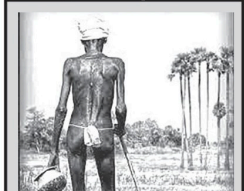
தமிழ், முஸ்லிம் உறவு முறிக்கவே கிளிநொச்சி பக்கிசியர்களில் 100 ஏக்கர் நிலத்தை நாசியல் வழங்கப்படுமா என்பது குறித்து ஏதாவது உட்கரணம் எடுக்க வேண்டும்.

அக்கரைப்பற்றில் இருவேறு பகுதிகளில் கஞ்சா பொதிகளுடன் இருவர் கைது. அக்கரைப்பற்றில் இருவேறு பகுதிகளில் கஞ்சா பொதிகளுடன் இருவர் கைது.