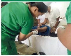
(தோட்டம் பிடித்த பிறகு)

பொகவந்தவாலை டிபன்சின் தோட்டப் பகுதியில் நுகரும் இலக்க தேயிலை மரங்களின் கீழே பரிந்துரைக்கப்பட்ட ஆண் நெடுவரை ஒருவர் மீது சிறுத்தை பயந்த தாக்கீதில் தாக்குதல்களுக்கானவர் பொகவந்தவாலை வைத்தியசாலையில் சேர்க்கப்பட்டுள்ளது. பொகவந்தவாலை மாவட்டம் தெரிவித்தது.