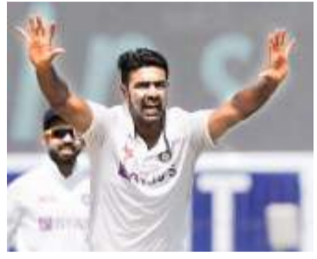
36 வயதான அஷ்வின் 2015 ஆம் ஆண்டு தரவரிசையில் முதல் முறை முதலிடத்திற்கு முன்னேறிய பின்னர் அந்த இடத்திற்கு பல தடவைகள் வந்துள்ளார்.

சர்வதேச கிரிக்கெட் களத்தில் டெஸ்ட் பந்துவீச்சாளர்களைக் காண தரவரிசையில் இங்கிலாந்து வேகப்பந்து வீச்சாளர் ஜேம்ஸ் அன்டர்சனை பிந்தள்ளி இந்திய சுழல்பந்து வீச்சாளர் ரவிசந்திரன் அஷ்வின் முதலிடத்திற்கு முன்னேற்றம் கண்டுள்ளார். அவுஸ்திரேலியாவுக்கு எதிரான இரண்டாவது டெஸ்ட் போட்டியில் ஆறு விக்ரெட்டுகளை வீழ்த்தியதை அடுத்தே அஷ்வின் முதலிடத்திற்கு முன்னேறியதோடு நியூசிலாந்துக்கு எதிரான இரண்டாவது டெஸ்ட் போட்டியில் இங்கிலாந்து அணி தோற்று நிலையிலேயே அன்டர்சன் இரண்டாவது இடத்திற்கு தள்ளப்பட்டார்.