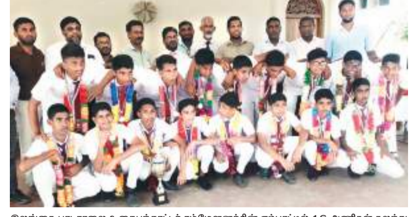
இலங்கை பாடசாலை உடைபந்தாட்டச் சம்மேளனத்தின் ஏற்பாட்டில் 16 அணிகள் கலந்து கொண்ட சமபோஷு வெற்றிக் கிண்ணப் போட்டியில் தேசிய ரீதியில் இரண்டாம் இடத்தைப் பெற்ற மருதமுனை அல்-மனார் மத்திய கல்லூரி மாணவர்கள் கல்முனை வலயக் கல்வி அலுவலகத்தினால் கௌரவிக்கப்பட்டு பிடிக்கப்பட்ட பதக்கத்தை காணலாம்.