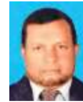
தயாரிப்பு எம். சதுரன் (jp) மாத்தளை சமுதரி நிருபர்