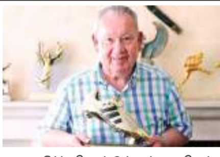
பகிர்ந்துகொண்டுள்ளார். மெல்ஸி இந்த கோல்களை பெற 26 போட்டிகளில் ஆடியுள்ளார் என்பது குறிப்பிடத்தக்கது. பிரான்ஸ் அணிக்காக 21 போட்டிகளில் மாதிரிமே ஆடிய பொன்டைன் 30 கோல்களை பெற்றார்.

ஒற்றை உலகக் கிண்ணத் தொடரில் அதிக கோல் பெற்று சாதனை படைத்த பிரான்ஸ் முன்னாள் காஸ்பந்து வீரர் ஜஸ்ட் பொன்டைன் தனது 89ஆவது வயதில் கடந்த புதன்கிழமை (01) காலமானார். 1958 ஆம் ஆண்டு சுவீடன்ில் நடந்த உலகக் கிண்ணப் போட்டியில் பொன்டைன் பிரான்ஸ் அணிக்காக ஆறு போட்டிகளில் பெற்று 13 கோல்கள் என்ற சாதனை இன்றுவரை முறியடிக்கப்படாமல் உள்ளது. இதன்மூலம் அவர் உலகக் கிண்ணத்தில் அதிக கோல் பெற்றவர் வரிசையில் ஆர்ஜுன்உனாவின் லியோனல் மெல்ஸியுடன் நான்காவது (13) இடத்தை