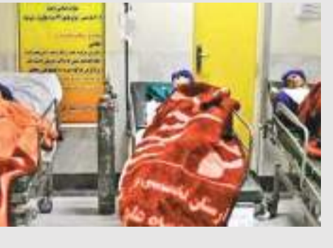
நகரான கெர்மன்ஷாவில் உள்ள பாடசாலைகளுக்கு அம்புலன்ஸ் வண்டிகள் விரைந்திருப்பதோடு மருத்துவமனைகளில் மாணவிகள் சிகிச்சை பெற்று வருகின்றனர். ஷியா புனித நகரான குவாமில் முதலில் இடம் பெற்ற இந்த விசமூட்டல் சம்பவங்கள் அதிகரித்திருக்கும் நிலையில் அரசு மீதான மக்களின் அமுத்தமும் அதிகரித்துள்ளது.

ஈரானில் மற்றொரு விச வாயு தாக்குதல் அலையால் 26 பாடசாலைகளைச் சேர்ந்த பல டஜன் பெண்கள் மருத்துவமனைகளில் அனுமதிக்கப்பட்டுள்ளனர். இவ்வாறான தாக்குதல்களால் கடந்த நவம்பர் தொடக்கம் 1,000க்கும் அதிகமான மாணவிகள் பாதிக்கப்பட்டுள்ளனர். அவர்கள் சுவாச பிரச்சினைகள், குமட்டல், தலைசுற்று மற்றும் சோர்வினால் பாதிக்கப்பட்டுள்ளனர். மகளிர் பாடசாலைகளை மூடும் முயற்சியாகவே இவ்வாறு திட்டமிட்ட விச வாயு தாக்குதல் இடம்பெறுவதாக பெரும்பாலானோர் சந்தேகிக்கின்றனர். எனினும் இதனை ஒரு திட்டமிட்ட தாக்குதலாக அரசு இன்னும் உறுதி செய்யவில்லை. இந்த நடுகூடல் சம்பவங்களின் மூல காரணியை கண்டு பிடிக்க ஜனாதிபதியால் தாம் நியமிக்கப்பட்டிருப்பதாக குறிப்பிட்டுள்ளார்.