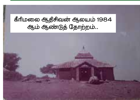
கீரிமலை ஆதிசிவன் ஆலயம் 1984 ஆம் ஆண்டுத் தோற்றம்..