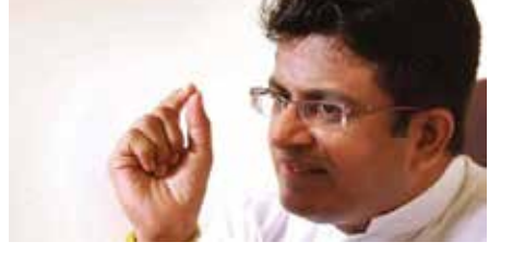
தமிழருக்கு எதிராக இனக் கலவரம், வன்முறை மற்றும் 30 வருடகால ஆபுத போராட்டம் ஆகியவற்றை ஊக்கிய தேசியக் கட்சியே ஆரம்பித்தது என குற்றம்சாட்டியுள்ளார்.

மேலும் மாகாண சபைத் தேர்தல் காலவரையறையின்றி பிற்போடப்பட்டுள்ளமைக்கு ஜனாதிபதி ரணில் விக்கிரமசிங்க பொறுப்புக் கூற வேண்டும் என்றும் குறிப்பிட்டுள்ளார். சுதந்திரத்தின் பின்னர் நாட்டில் தேற்றம் பெற்ற