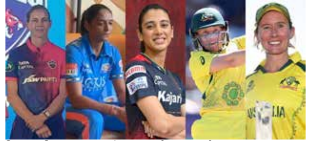
மோத வேண்டும். லீக் முடிவில் புள்ளிகள் அடிப்படையில் முதல் 4 இடங்களை பிடிக்கும் அணிகள் "பிளே ஓவ்" சுற்றுக்கு தகுதி பெறும் என்பது குறிப்பிடத்தக்கது. (ஐ)

மும்பை, மார்ச் 04 ஐ. பி. எல். 20 ஓவர் போட்டியை போன்று பெண்களுக்கு பிறிமீயர் லீக் போட்டியை நடத்த இந்திய கிரிக்கெட் கட்டுப்பாட்டு சபை (பி.சி.சி.ஐ.) முடிவு செய்தது. இதன்படி முதலாவது மகளிர் பிறிமீயர் லீக் (டபிள்யூ. பி. எல்.) 20 ஓவர் போட்டி மும்பையில் இன்று சனிக்கிழமை இரவு 7.30 மணிக்கு தொடங்குகிறது. எதிர்வரும் 26ஆம் திகதி வரை நடைபெறவுள்ள இந்தத் தொடரில் டில்லி கப்பிடல்ஸ், குஜராத் ஜெயன்ட்ஸ், மும்பை இந்தியன்ஸ், ரோயல் சலஞ்சர்ஸ் பெங்களூர், உ. பி. வோரியர்ஸ் ஆகிய 5 அணிகள் பங்கேற்கின்றன. ஓவ்வொரு அணியும் மற்ற அணியுடன் தலா 2 முறை