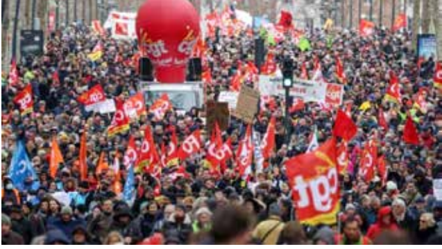
பாரிஸ், மார்ச் 06

ஓய்வூதியச் சீரமைப்புக்கு எதிரான தொழிலாளர் போராட்டங்கள் பிரான்ஸில் அடுத்த கட்டத்தை நோக்கி நகர்கின்றன.