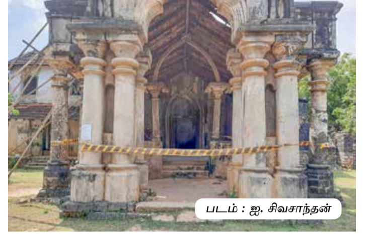
படம் : ஐ. சிவசாந்தன்

யாழ்ப்பாண இராச்சிய காலத்தில் அரசனின் அமைச்சரின் வாசஸ்தலமாக இது பயன்படுத்தப்பட்டது என்று கருதப்படுகின்றது. ஆனால், பின்னாட்களில் யாழ்ப்பாணத்தை கைப்பற்றிய ஐரோப்பியர் காலத்தில் இந்த மந்திரிமனை திருத்தி அமைக்கப்பட்டதாகக் கூறப்படுகின்றது. எனினும், 1890ஆம் ஆண்டில் இந்தக் கட்டடம் அமைக்கப்பட்டதாக இந்தக் கட்டடத்தில் பொறிக்கப்பட்டுள்ளது. 130 வருடங்களுக்கு