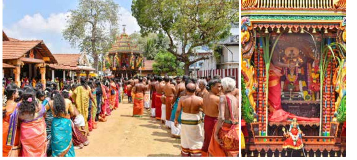
யாழ்ப்பாணம் நகரின் கன்னாதிட்டி காளி அம்பாள் ஆலய தேர்த்திருவிழா நேற்று பக்தியூவர் மாக இடம்பெற்றது...