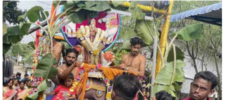
ஆலங்கேணி விநாயகர் ஆலய தீர்த்த உற்சவம் நேற்று நடைபெற்றது. இதன்போது சுவாமி வீதி வலம் வந்து தீர்த்தக்கரைக்கு செல்வதை காணலாம். (அ-04)