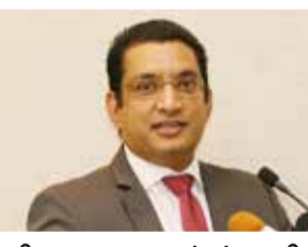
விவகார அமைச்சர் அலி சப்ரி.

வடக்கு காற்றாலை திட்டத்துக்காக அதானியை காட்டியது இந்திய அரசே கவலையில்லை என்கிறார் அலி சப்ரி புதுடில்லி, மார்ச் 07 வடக்கு மாகாணத்தில் காற்றாலை திட்டம் உள்ளிட்ட உள்கட்டமைப்பு திட்டங்களுக்கு அதானி குழுமத்தை அடையாளம் காட்டியது இந்திய அரசாங்கம்தான். அதானியின் திட்டங்களை அரசாங்கத்துக்கான ஒப்பந்தமாகவே பார்கிறோம் என்று கூறியிருக்கிறார் வெளி 15 அளித்த நேர்காணலிலேயே மேற்கண்டவாறு தெரிவித்தார். இலங்கையில் துறை முகம், விமான நிலையம் மற்றும் மின் உற்பத்தி திட்டங்களில் அதானி நிறுவனம் ஈடுபட்டுள்ளது. அதானி நிறுவனங்களின் பங்குகள் வீழ்ச்சி அடைந்ததால் இலங்கை 15