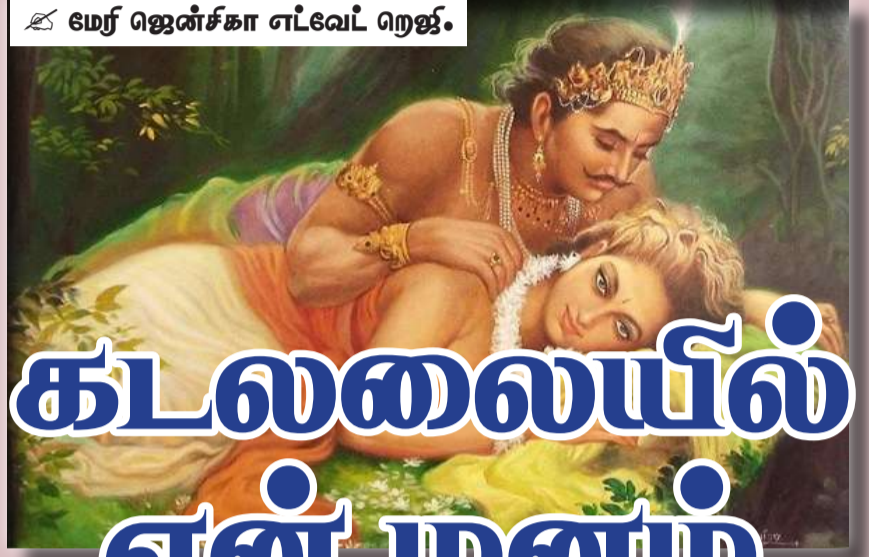
✍ மேர் ஜென்சகா எட்டேவட் ரெஜ்.