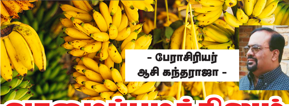
- பேராசிரியர் ஆசி கந்தராஜா -