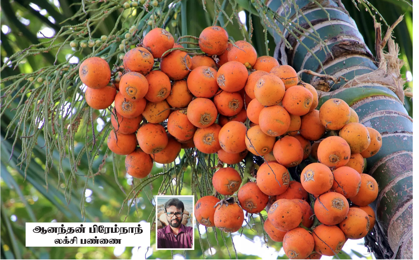
ஆனந்தன் பிரேம்நாந் லக்ஷி பண்ணை