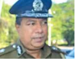
மத்திய பிராந்திய பிரதி பொலிஸ்மா அதிபர் தகவல்