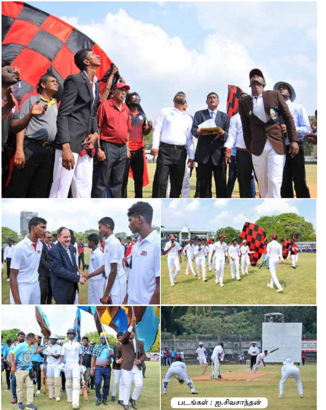
படங்கள் : ஐ.சிவசாந்தன்

இதனிடையே, 6 பெளண்ட்ரிகளுடன் 84 பந்துகளில் 42 ஓட்டங்களை சேர்த்த சஞ்சயன் ஆட்டமிழந்தார். அடுத்து வந்த நியூட்டன் 0, அணித் தலைவர் கஜன் 5, சயந்தன் 11, அபிலாஷ் 15, அனுசாந்த் 27 என வேகமாக விக்கெட்களை பறிகொடுத்தனர். மறுமுனையில் நிலைத்து அபாரமாக ஆடிய அஜய் 77 பந்துகளில் 6 பெளண்ட்ரிகள் 2 சிக்ஸர்களுடன் 74 ஓட்டங்களை குவித்து இறுதி விக்கெட்டாக ஆட்டமிழந்தார். 66.2 ஓவர்களில் சகல விக்கெட்களையும் இழந்து 279 ஓட்டங்களைப் பெற்றது சென். ஜோன்ஸ் கல்லூரி அணியின் பந்துவீச்சில் விதுசன் 4 விக்கெட்களையும் அபிசேக் 3 விக்கெட்களையும் கஜகர்ணன் 2 விக்கெட்களையும் கைப்பற்றினார். பதிலுக்கு தனது முதல் இனிங்ஸை தொடங்கிய சென். ஜோன்ஸ் கல்லூரிக்கு நேசுகுமார் ஜெஷீல், அண்டர்சன் சச்சின் ஆகியோர் தொடக்கம் கொடுத்தனர். சச்சின் 6 ஓட்டங்களுடன் வெளியேறவே, அடுத்த வந்த கிந்துசன் ஒரு பெளண்ட்ரி, ஒரு சிக்ஸருடன் 11 ஓட்டங்களை விளாசிவிட்டு ஆட்டமிழந்தார். அடுத்து வந்த ஜனத்தன் ஓட்டம் எதுவும் பெறாமலேயே வெளியேறினார். நேற்றைய நாள் ஆட்டம் முடிவில் 17 ஓவர்களை சந்தித்த சென். ஜோன்ஸ் கல்லூரி 3 விக்கெட்கள் இழப்புக்கு 43 ஓட்டங்களை எடுத்திருந்தது. ஜெஷீல் 16 ஓட்டங்களுடனும் அணித் தலைவர் சபேசன் 9 ஓட்டங்களுடனும் ஆட்டமிழக்காமல் உள்ளனர். யாழ். மத்திய கல்லூரியின் பந்துவீச்சில் அனுசாந்த் 2 விக்கெட்களையும் நியூட்டன் ஒரு விக்கெட்டையும் கைப்பற்றினார். இன்று போட்டியின் இரண்டாவது நாளாகும். (ஐ)