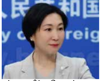
பங்கை வகிக்க, தொடர்புடைய நாடுகள் மற்றும் சர்வதேச நிதி நிறுவனங்களுடன் இணைந்து பணியாற்ற சீனா தயாராக

இலங்கையின் தற்போதைய சவால்களை சமாளிக்கவும், கடன் சுமையை எளிதாக்கவும், நிலையான வளர்ச்சியை அடையவும் உதவுவதில் சாதகமான