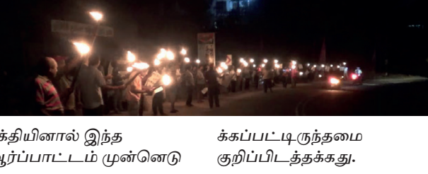
சக்தியினால் இந்த ஆர்ப்பாட்டம் முன்னெடுக்கப்பட்டிருந்தமை குறிப்பிடத்தக்கது.

மின்கட்டணத்தை அதிகரித்தமைக்கு எதிர்ப்புத் தெரிவித்து, சர்வதேச மகளிர் தினமான மார்ச் 8 ஆம் திகதி, நாலைப்பிட்டிய பல்லைகம பிரதேசத்தில் பந்தமேந்தி எதிர்ப்பு ஆரம்பிட்டும் மேற்கொள்ளப்பட்டது. தேசிய மக்கள்