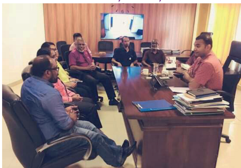
டொக்டர்கள், கிணறுகளில் காணப்படும் தொற்று நிலைமை,